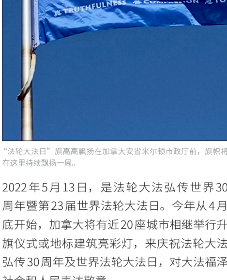
“法轮大法日”旗高高飘扬在加拿大安省米尔顿市政厅前，旗帜将在这里持续飘扬一周。

2022年5月13日，是法轮大法弘传世界30周年暨第23届世界法轮大法日。今年从4月底开始，加拿大将有近20座城市相继举行升旗仪式或地标建筑亮彩灯，来庆祝法轮大法弘传30周年及世界法轮大法日，对大法福泽社会和人民表达敬意。