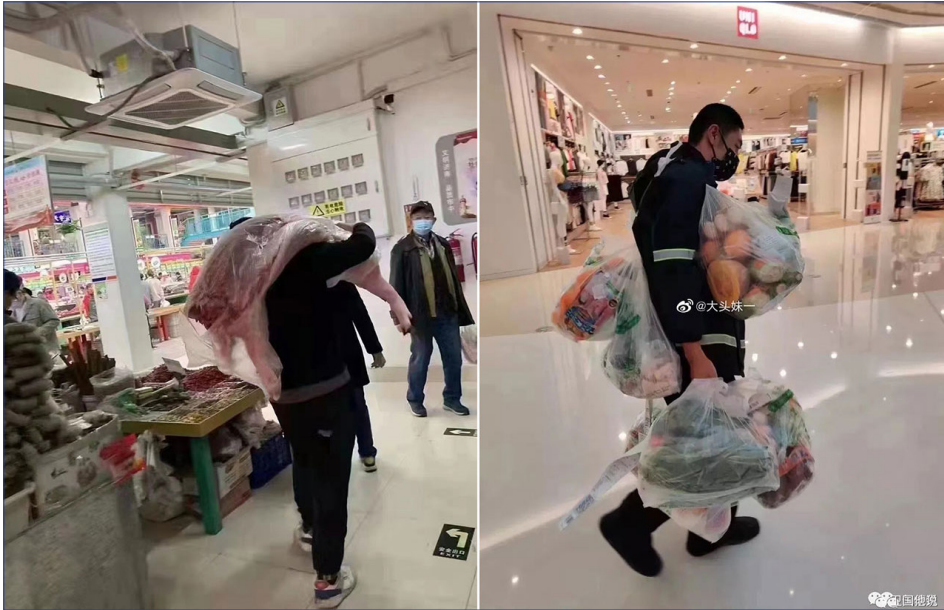
左：一顾客抢购半扇猪肉回家储藏；右：北京一年轻人大包小袋把食物带回家。

最近，北京又爆发新一轮疫情，尽管发现的病例数跟上海比是小巫见大巫，但北京却破天荒地出现了抢购潮，大量北京市民都在为不知何时会到来的“封城”疯狂囤货。