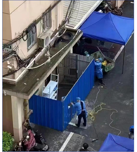
2022年4月23日，上海多个小区居民楼门被铁网或铁皮封锁。（网络图片）

上海市不断延长的封城措施，加剧民怨。4月23日，网传上海浦东防疫部门出台文件，要求封控区楼宇进行“硬隔离”，即在楼宇出口设立挡板，引发上海居民强烈抗议。