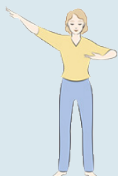
第一套功法 佛展千手法