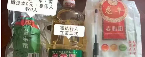
上：上海梅陇镇镇政府发放的物资；下：网友曝光保供食品的连公司都注销了还能进小区。

梅陇镇民众近日纷纷晒出收到的政府物资，许多猪肉全是肥肉，而且位置很多都集中在“猪奶头”，引发网络怒火。4月16日，梅陇镇政府在微博上发帖，承认保障物资中猪肉存在质量问题，并说出与梅陇镇镇政府签订《保供协议》的是上海咨谕实业有限公司，还声明该企业是有相关资质的。