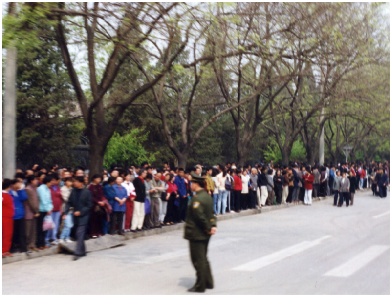
1999年4月25日，上万名法轮功学员到国家信访局上访。

1996年，中宣部指使《光明日报》刊文诋毁法轮功。1998年7月，公安部采取“先定罪、后调查”的程序，在新疆、黑龙江等地，诱发基层公安