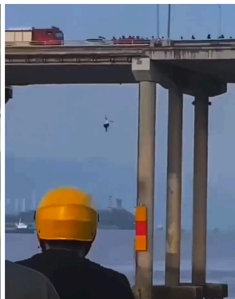
左：一楼门外，一位老人饿到拼命喊“救命”；右：封堵在高速，车上的货物全烂了，人跳江了。（视频截图）

“树下野狐”：我不能代表所有的上海人，但我认为很多上海人都和我此刻想的一样。请立刻停止以“防疫”之名任意践踏上海市民的权利和尊严！……请还给每一个健康的上海人自由生活、工作、吃饭与购物的权力！