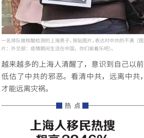
一名排队做核酸检测的上海男子，背贴图片，表达对中共的不满（图片：外交部：疫情期间生活在中国，你们偷着乐吧）。

一则视频显示，上海某小区一位大叔把口罩戴在下巴底下，痛骂上海极端防疫，大声喊道：打倒共产党！