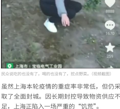
民众说吃的也没有了，喝的也没有了，挖点野菜。(视频截图)

虽然上海本轮疫情的重症率非常低，但仍采取了全面封城。因长期封控导致物资供应不足，上海正陷入一场严重的“饥荒”。