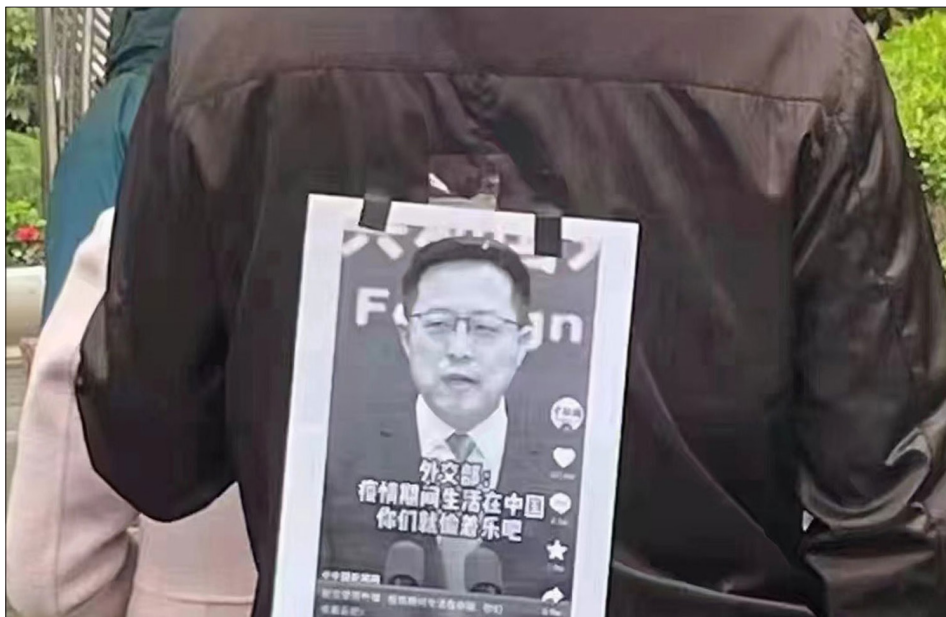
一名排队做核酸检测的上海男子，背贴图片，隐晦地表达对中共的不满（图片：外交部：疫情期间生活在中国，你们就偷着乐吧）。

上海无人性的“清零防疫”导致民怨沸腾，也令许多中国人对中共体制彻底绝望。网文《上海人民的忍耐已经到了极限》阅读量超过2000万。