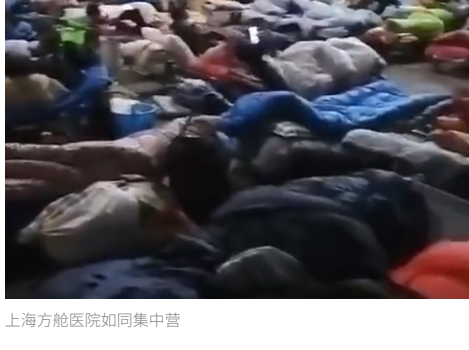
上海方舱医院如同集中营

据上海卫健委信息，4月6日上海新增新冠肺炎确诊病例322例和无症状感染者19660例，即98.4%都是无症状的。这佐证了国际社会普遍认可的结论：Omicron病毒比较温和，杀伤力没那么大，Omicron毒株的疫情基本上就是个大号流感。