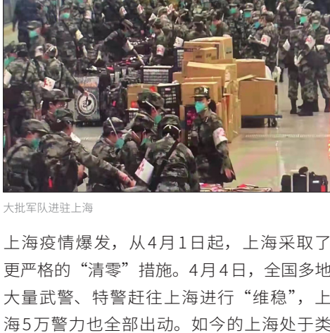
大批军队进驻上海

上海疫情爆发，从4月1日起，上海采取了更严格的“清零”措施。4月4日，全国多地大量武警、特警赶往上海进行“维稳”，上海5万警力也全部出动。如今的上海处于类似被军管的状态，“清零”造成的民生灾难远超解决的问题。