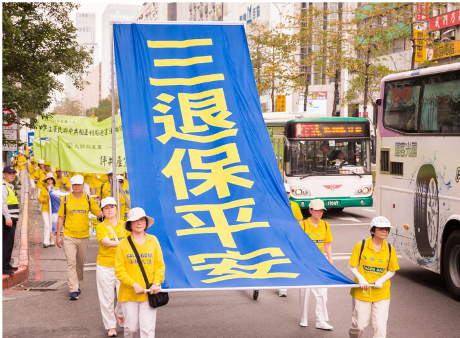
2018年4月22日，台湾法轮大法学会举办全球声援三亿人退出中共党、团、队活动。