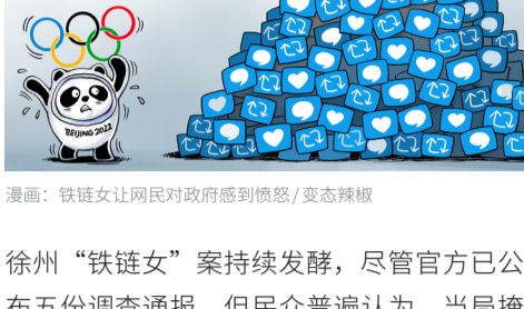
漫画：铁链女让网民对政府感到愤怒 / 变态辣椒

徐州“铁链女”案持续发酵，尽管官方已公布五份调查通报，但民众普遍认为，当局掩盖真相，包庇真凶。