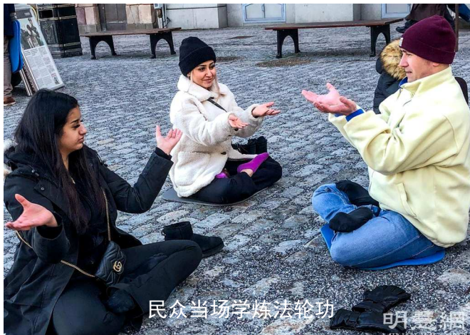
民众当场学炼法轮功

们进一步讲了很多真相，揭露天安门自焚伪案的骗局，以及中国人为什么要退出党、团、队才能保平安。当两名留学生得知，学员可以协助他们在退党网站办理三退，非常高兴，当场就声明退出共青团。