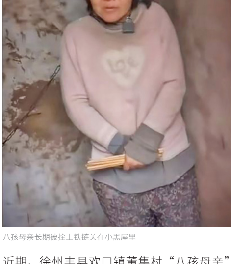
八孩母亲长期被拴上铁链关在小黑屋里

近期，徐州丰县欢口镇董集村“八孩母亲”的悲惨遭遇引起全网关注。视频中在一处破屋里，这位母亲在气温接近0度下光着脚，穿着单薄上衣，脖子上拴着一条铁链。徐州公安给出的通告称，八孩母亲办理合法手续，登记结婚，并非人口拐卖。