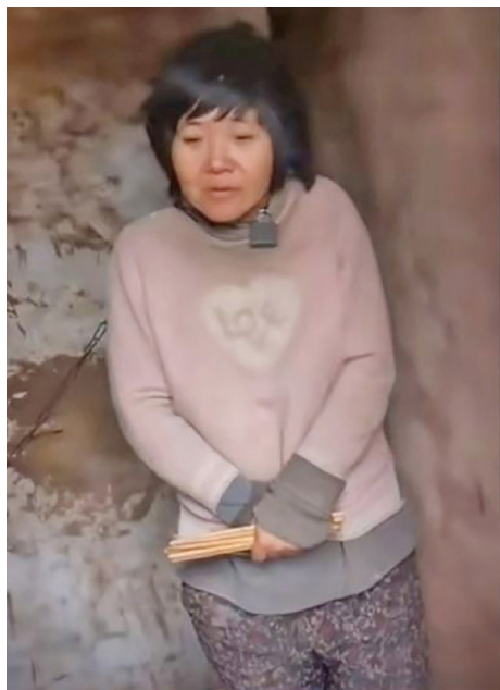
八孩母亲长期被拴上铁链关在小黑屋里

近期,徐州丰县欢口镇董集村“八孩母亲”的悲惨遭遇引起全网关注。视频中在一处破屋里,这位母亲在气温接近0度下光着脚,穿着单薄上衣,脖子上拴着一条铁链。徐州公安给出的通告称,八孩母亲办理合法手续,登记结婚,并非人口拐卖。