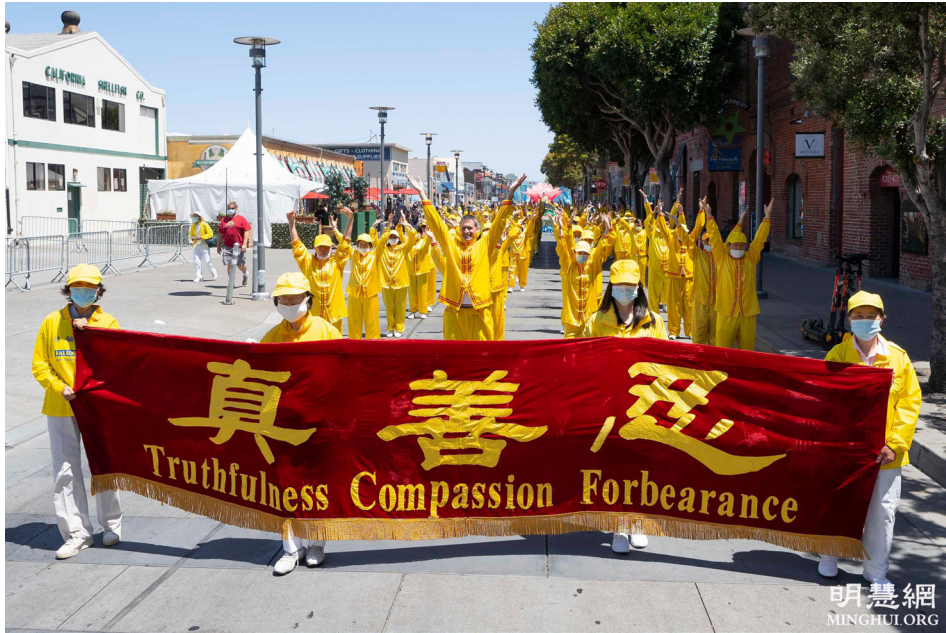
2021年5月8日，旧金山法轮功学员举行游行，庆祝“世界法轮大法日”。