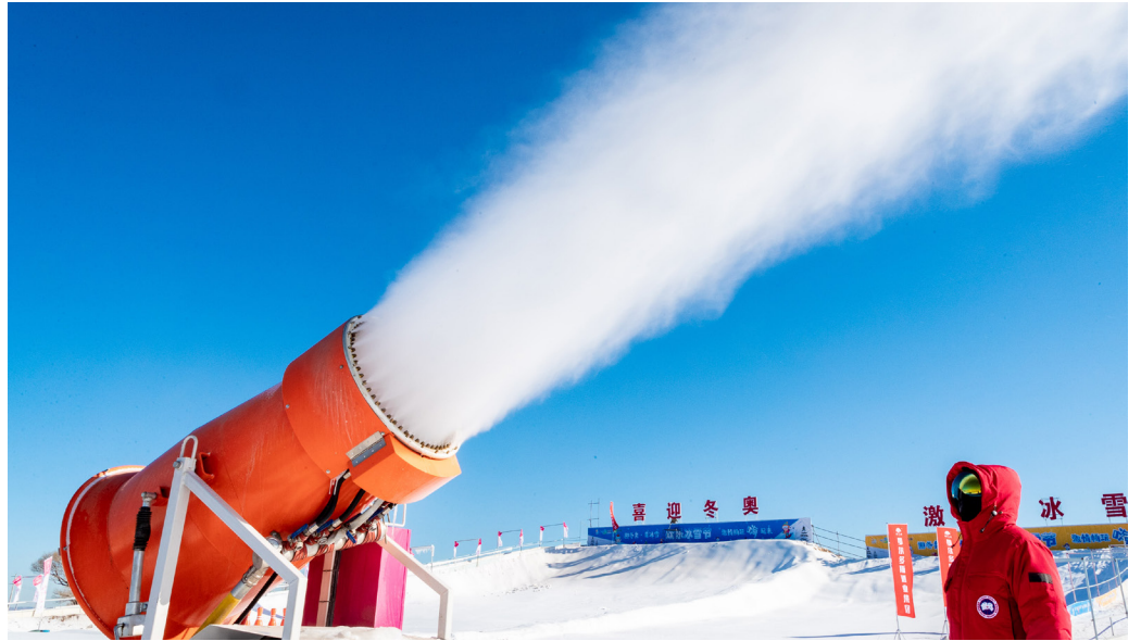
2022年北京冬奥会人工造雪

北京的2008年夏季奥运会花费了420亿美元。而这次北京称要办一场“简约、安全、精彩”的冬奥会，只花39亿美元就能达到目标。但是外媒经过调查，发现本次冬奥会至少花费了385亿美元，是中共官方自称数目的10倍。