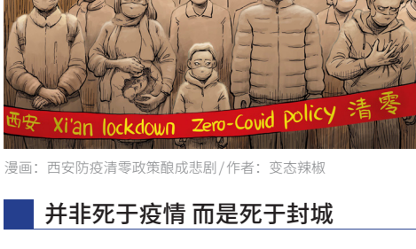
漫画：西安防疫清零政策酿成悲剧 / 作者：变态辣椒