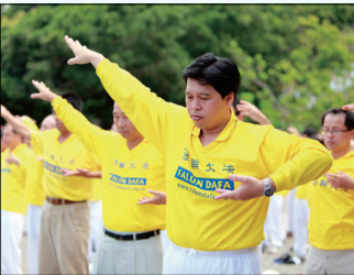
第一套功法-佛展千手法

在李洪志老师所著的《法轮大法大圆满法》里有对法轮大法功法特点的讲解、五套功法的动作图解和动作机理。动作一方