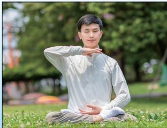
第五套功法-神通加持法

面是用强大的功力把功能加强；另一方面在身体里还要演化出许多生命体。五套功法简单易学，适合所有年龄的人，男女老少皆可炼。