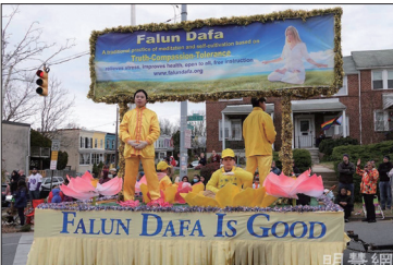
法轮功学员参加了马里兰州最大城市巴尔的摩举办的圣诞游行。