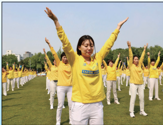
第三套功法-贯通两极法