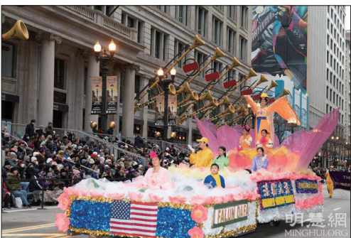
左图:大纽约地区的法轮功学员组成的天国乐团、旗队、舞龙队和腰鼓队应邀参加纽约老兵节游行。右图:法轮功学员参加了芝加哥举办第八十七届感恩节大游行。

二十六届圣诞游行，给经历瘟疫大流行后的小镇，带来了节日的欢乐和传统的回归。法轮功腰鼓队的表演，受到民众热烈欢迎。12月5日，马里兰州最大城市巴尔的摩举办圣诞节游行，数万现场民众观看。第一次看到法轮功学员游行队伍的民众说，他们把美妙的能量带到巴尔的摩，真、善、忍正是当下这个世界所需要的。