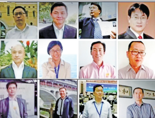
部份为法轮功学员无罪辩护的正义律师

二十几年来有上百位正义律师为法轮功学员做了上千场无罪辩护，包括高智晟、王全璋、余文生、李和平、谢燕益、江天勇、唐吉田与张赞宁等。律师们有理有据有力地全面论证了：修炼法轮功是合法的，对法轮功学员的拘禁、劳教、判刑等行为都是违反中国的宪法和法律的。