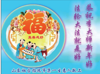
中国民众祝贺李洪志大师贺卡