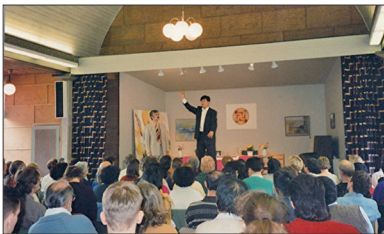
1995年4月李洪志大师在瑞典哥德堡举办了七天的传功讲法班

1995年3月13日李洪志大师受中国驻法大使馆的邀请，在巴黎使领馆文化处举行一场讲法报告会及第一场海外法轮功学习班，法轮功正式走向海外。同年4月14日李洪志大师来到瑞典哥德堡举办了第二场海外法轮功学习班。1996年10月12日在休士顿讲法，当天被休士顿市长宣布为“李洪志大师日”，并被授予“荣誉市民”和“亲善大使”的称号，法轮功开始在世界各地弘传。