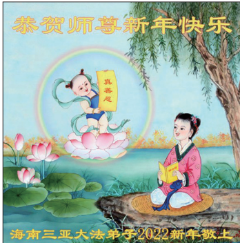
来自中国的大法弟子贺卡