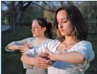
第四套功法-法轮周天法