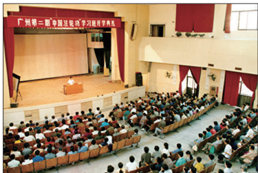
李洪志先生1993年10月在中国法轮功广州第二期传授班上讲法传功

1992年9月法轮功被确定为中国气功科研会的直属功派。1992年和1993年李洪志先生应邀参加北京东方健康博览会，展现了祛病健身的奇效，引起轰动，赢得大会唯一最高奖项“边缘科学进步奖”，李先生荣获“受群众欢迎气功师”的称号。