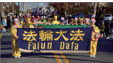
法轮功腰鼓队参加特拉华州的埃斯米尔镇的圣诞游行。