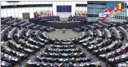
2013年欧洲议会通过“停止中共活摘器官”紧急议案。

欧洲议会曾在2013年12月通过紧急决议案，要求中共停止活摘器官。其他欧洲国家如比利时参众议院、挪威国会、意大利参议院、爱尔兰议会等都相继通过支持议案，呼吁制止迫害法轮功。