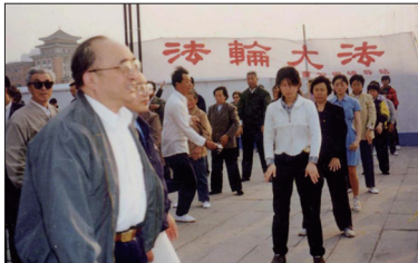
1998年5月15日国家体育总局局长伍绍祖视察法轮功学员炼功。

1993年8月中国公安部中华见义勇为基金会发出《中华人民共和国公安部致中国气功科学研究会感谢信》，对李洪志先生及法轮功的神奇祛病健身功效给予高度肯定。同年12月27日，公安部所属中华见义勇为基金会授予李洪志先生荣誉证书。由于法轮功在祛病健身、提升道德方面具有神奇功效，很多人身心受益从疑难绝症中康复，口耳相传，使法轮功在中国迅速普及。