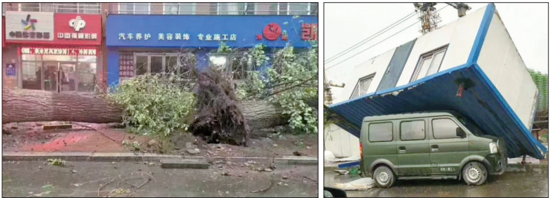
2017年5月5日通化市狂风过后的街道

又冷又怕的张妈妈突然想起炼法轮功的亲友讲的“遇到危难时求救法轮功师父”，就在心里诚恳的说：“法轮功大师，我遇到困难回不了家了，求求您帮我回家吧”！想了两遍后像吃了定心丸，闯入风雨之中往家走！路上遇见一个男人领着一个小学生，他们差点被风吹倒，互拥着蹲在地上；汽车都被风吹的在摇晃，张妈感觉自己是一个大铁坨坨，风根本吹不动她。她淌着近一尺深的水走了一小时终于到家，进家门时张妈的皮鞋被水灌满了，上衣和裤子往下淌水，可里面的衣服全是干的！张妈愣愣的站在门厅里，想着外面风狂雨暴的场景，突然想起来了：这不是大法师父保护我了吗？马上说：大师太谢谢您了，我怎么感谢您呢？我给您跪下吧！