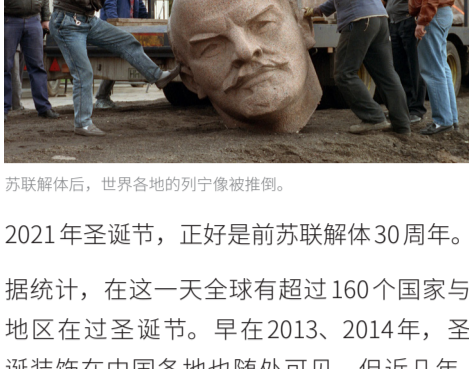
苏联解体后，世界各地的列宁像被推倒。

2021年圣诞节，正好是前苏联解体30周年。据统计，在这一天全球有超过160个国家与地区在过圣诞节。早在2013、2014年，圣诞装饰在中国各地也随处可见。但近几年，中共对圣诞节的管控收紧，称其是“国耻节”。2021年打压升级，官方事先警告几千万基督徒，禁止庆祝圣诞，部分地区的教育单位还发出通知，禁止学校师生庆祝；有人因为扮演圣诞老人，遭到警方逮捕。