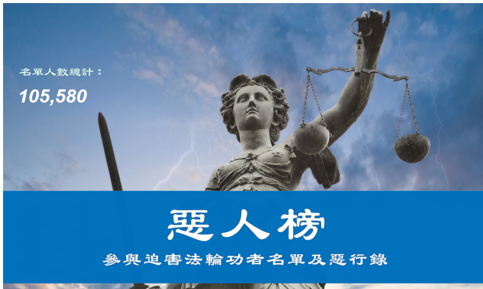
法轮大法明慧网上的恶人榜

据明慧网报导，12月10日国际人权日前后，美国、英国、澳大利亚、加拿大等36国法轮功学员，将中共迫害法轮功的新一批恶人名单递交本国政府，要求依据《马格尼茨基人权问责法》等法律，实施制裁。