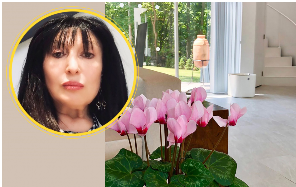
纽约珠宝商盖德女士染武汉肺炎后，念“九字真言”痊愈。

目前，奥密克戎已经传播94个国家，中国大陆已经有多个城市出现。而欧美医学机构陆续证明，在变异病毒面前，疫苗的作用大打折扣。