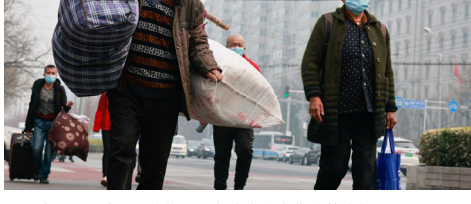
2021年3月，全国两会期间，行走在北京街头的人们。

据中国国际金融股份有限公司（中金公司）的调查结果，中国有超过2.2亿人的平均月收入不到500元。