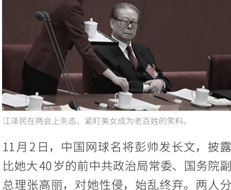
江泽民在两会上失态、紧盯美女成为老百姓的笑料。

11月2日，中国网球名将彭帅发长文，披露比她大40岁的前中共政治局常委、国务院副总理张高丽，对她性侵，始乱终弃。两人分手前发生激烈争吵。张高丽曾经讲，我不怕。