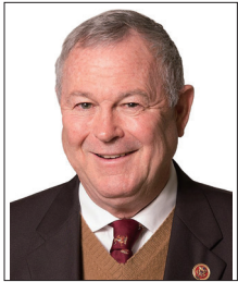
美国加州众议员达纳·罗拉巴克

前加拿大司法部长、检察长、知名国际人权律师考特勒先生表示很欣赏法轮功的价值基础,包括真善忍,这些准则既支撑了古老中国价值观念,又反映了普世的价值。