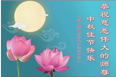
来自中国的大法弟子贺卡