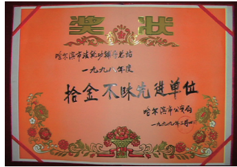
1999年3月4日哈尔滨市法轮功辅导总站被哈尔滨市公安局评为1998年度拾金不昧先进单位。

修炼法轮功的民众不但改善身体状况,为国家节省大量医疗费,而且遵循真善忍法理不计个人得失、善待他人,经亿万人的修炼实践证明,法轮大法修的是大法大道,在把真正修炼的人带到高层次的同时,对稳定社会、提高人们的身体素质和道德水准也起到不可估量的正面作用。这样一个巨大的信仰团体成为中国