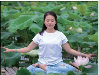
第五套功法-神通加持法