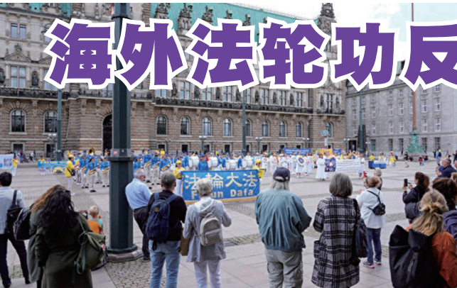
德国和周边国家的部分法轮功学员在汉堡市政厅前集会，呼吁公众帮助制止中共对法轮功长达22年的迫害。