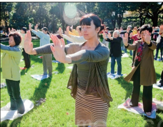
第一套功法-佛展千手法