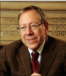
前加拿大司法部长、知名国际人权律师考特勒

美国加利福尼亚州共和党联邦众议员达纳·罗拉巴克公开指出,法轮功作为一种信仰只能对世界有利,不仅对中国,对美国,对全世界都有帮助。罗拉巴克说:“法轮功,我和所有其他的人们都相信,是这个世界唯一的希望!”