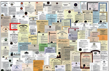
海外各界褒奖及支持信函

法轮功洪传全世界,为各地社会带来可喜的变化,因此受到各地民众和政府的欢迎,法轮大法造福人类,被称为“高德大法”。国际社会为表彰李洪志先生和法轮大法对人类身心健康所作出的杰出贡献,至今获得来自全球褒奖有3484项,支持议案535件,支持信函1434封。