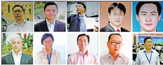
部份为法轮功学员无罪辩护的正义律师

面对这场前所未有的邪恶迫害，二十二年来海内外法轮功学员坚持不懈地和平理性向世人讲清真相。越来越多的中国民众在了解真相后从当初对法轮功的误解转向同情、支持和敬佩。