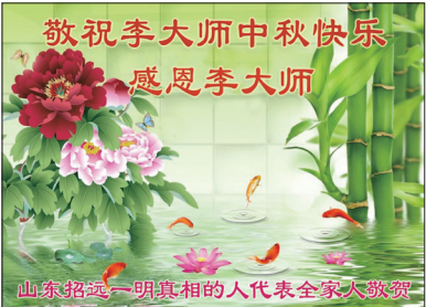
中国民众祝贺李洪志大师贺卡