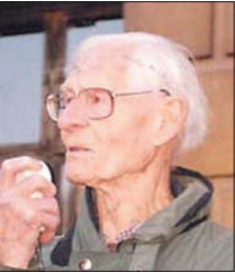
前英国驻爱尔兰大使福昂西斯爵士

法轮大法像一股清流,从中国流传出在海外蓬勃发展。大法所提倡的“真善忍”被许多国家的有识之士视为全人类的共同行为规范和道德基石。许多西方人诚挚地说:“法轮大法属于全世界,世界需要真、善、忍。”