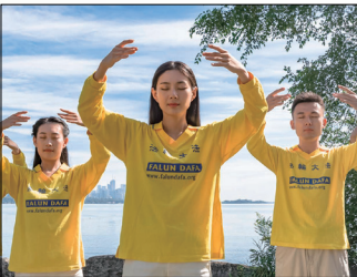
第二套功法-法轮桩法