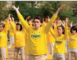
第三套功法-贯通两极法