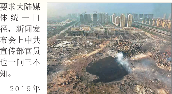
天津滨海新区危化品仓库大爆炸，死伤惨重。

要求大陆媒体统一口径，新闻发布会上中共宣传部官员也一问三不知。2019年在武汉疫情封锁信息，谎称可防可控，致使疫情扩散全国乃至全世界。今年7月河南郑州无预警泄洪，造成特大水灾大量人员伤亡惨绝人寰，当局掩盖真实死亡人数。中共一向以其掌握的宣传工具，大搞新闻封锁和“舆论导向”，隐瞒乱象，粉饰太平。从历史到今天的一桩桩事件，像“剥画皮”一样逐一揭露，中共其邪恶本质从未改变。