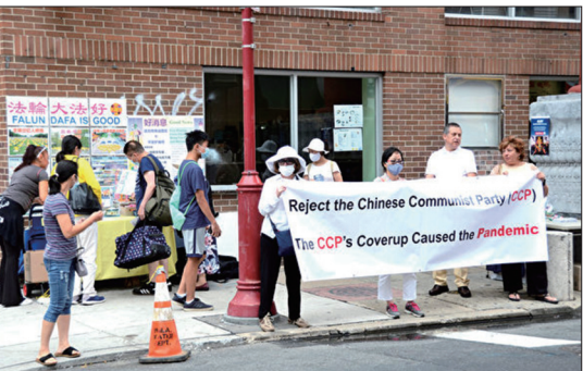
2021年8月8日部分法轮功学员在费城中国城举办“解体中共”的活动。

不仅仅是政治因素，许多富有的中国人正在逃离中国，他们是为后代寻找更好的教育机会，同时也是为了保证政治安全和财产安全。