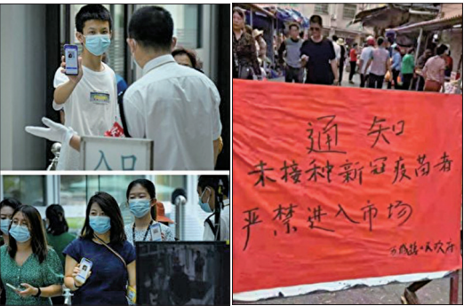
左图:北京的公共场所设置检查健康码，否则不能入内。右图:中国各地强制民众打疫苗，不接种就不能进商场。

中国国内的许多地方号称接种疫苗达到90%以上，但它们还是采取了封城、封区的做法来防止疫情扩散，显示中共自己对国产疫苗都没有足够的信心。