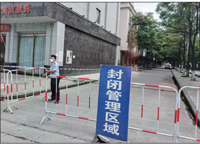
云南省西南部与缅甸接壤的瑞丽市，一条街因疫情被封锁。