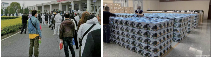
左:武汉汉口殡仪馆门外领骨灰的民众大排长龙。 右:殡仪馆十几位男性工作人员来到大货车上，把骨灰盒搬到静雅厅的侧厅存放，每500个一垛，一共有7垛。