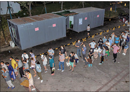
南京居民连夜排队进行病毒核酸检测

南京禄口机场7月爆发的Delta变种病毒向全国扩散，已接种疫苗者也出现感染病例。截至8月7日全国高风险地区已升至7个，中风险地区已达到197个，分布在江苏、湖南、四川、湖北云南、山东、海南、辽宁、福建、内蒙古、上海及北京等13个省市。