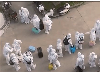
江苏省扬州市的Delta变种病毒疫情正在延烧，封城规模超过2020年。

多个中共内部文件显示，早在2020年1月15日中共内部就开始部署病毒的防控方案及进行秘密培训。大纪元独家获得1月16日中共内部防疫会议的图片，证实中共对外隐瞒疫情真相。