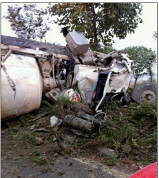
搅拌车驾驶舱完全损坏，车辆严重损毁。

原来这位司机所在单位的办公室里，常放有法轮功真相资料、《九评共产党》、大法书等，大家都在看，司机也主动看，司机明白真相后让单位法轮功学员帮他退出了中共邪党的一切组织。这次遇重大车祸，他居然能够安然无恙，是法轮大法救了他，法轮功学员讲的确实是真的啊！