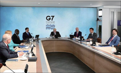
2021年6月12日七大工业国集团领导人在英国康沃尔郡卡比斯湾举行的G7峰会。

七大工业国集团（G7）峰会领袖6月12日开会时，要求世界卫生组织（WHO）进一步调查新冠疫情起源。