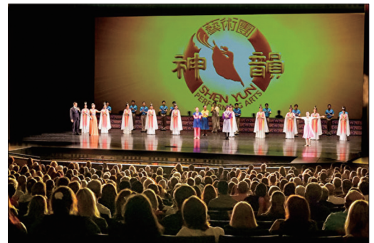
8月3日晚神韵巡回艺术团首临南达科达州拉皮德城的丰碑剧院演出。

神韵艺术团随着全美范围内放宽剧院演出的限制，展开全美巡回。8月3日晚神韵巡回艺术团首次莅临南达科他州拉皮德城（Rapid City）的丰碑剧院的演出，在观众的热烈掌声和不舍中落幕。观众赞佩，这是一次美丽神奇的中国神传文化之旅，触动心灵，带来启迪。本次演出前夕，拉皮德城市长史蒂夫·阿兰德颁发褒奖，欢迎神韵艺术团的到来，并宣布8月3日为“传统与神性艺术日”。