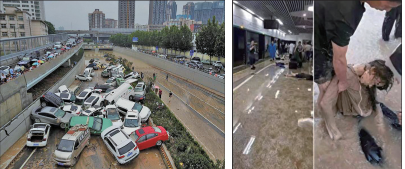
郑州洪水渐渐退去后，在京广隧道出入口处逾百辆车露出了水面。

捷运5号线有1列车在隧道里被淹没，一列车至少10节车厢，每节车厢下班时应该有几十人，总共有数百乘客，但只有少数车箱有人破窗逃生。