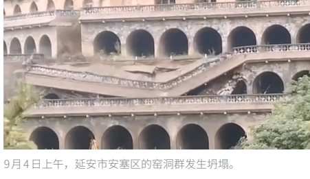
9月4日上午，延安市安塞区的窑洞群发生坍塌。

在网民热议“北京黑天鹅事件”的同时，中共所谓的“革命圣地”延安的窑洞群发生坍塌事件。据《陕西都市快报》消息，9月4日上午，延安市安塞区腰鼓山的窑洞群发生坍塌，至少造成6孔窑洞坍塌。视频显示，场面怵目惊心，不过附近围观民众却一片欢呼。