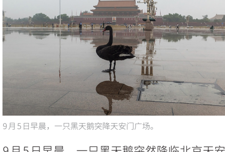
9月5日早晨，一只黑天鹅突降天安门广场。

9月5日早晨，一只黑天鹅突然降临北京天安门广场。它在广场上时而梳理羽毛，时而闲庭信步，而周边有4辆警车“守护”。黑天鹅罕见“光临”天安门广场，引来游人围观、拍照。当日上午8时，黑天鹅被动物保护部门带走。