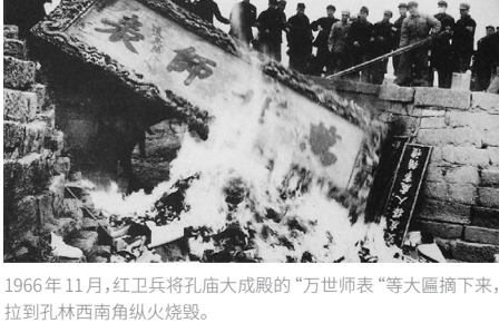
1966年11月，红卫兵将孔庙大成殿的“万世师表”等大匾摘下来，拉到孔林西南角纵火烧毁。