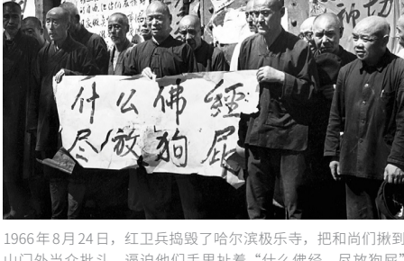
1966年8月24日，红卫兵捣毁了哈尔滨极乐寺，把和尚们揪到山门外当众批斗，逼迫他们手里扯着“什么佛经，尽放狗屁”的标语自辱门楣，以示与“封建迷信”彻底决裂。