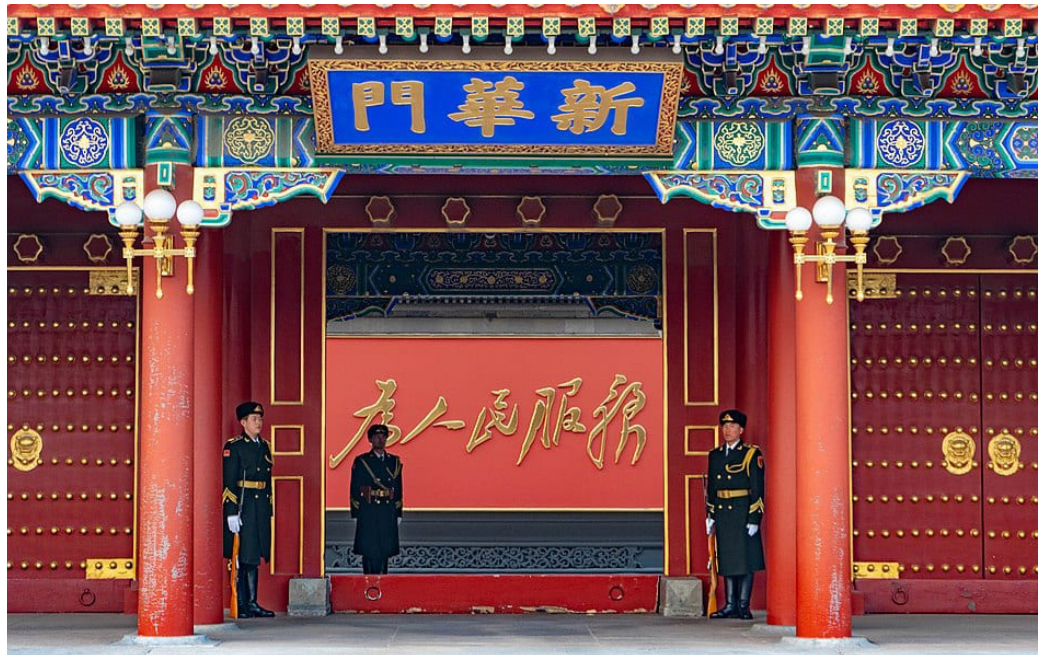
真正的超级富豪都在挂着“为人民服务”标语的中南海。

8月17日中共财经委会议抛出所谓“共同富裕”政策，要透过税收等工具手动进行民间财富“三次分配”，民间资金和外资闻风丧胆，加速逃离暗潮涌动。