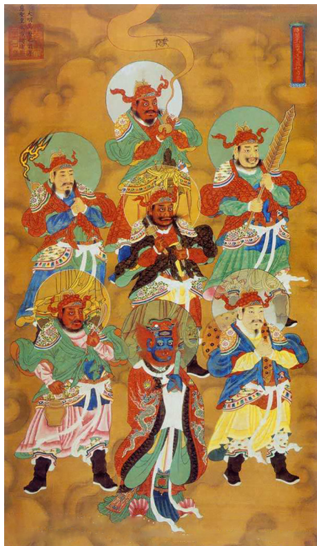
明代万历年间的五瘟神画像