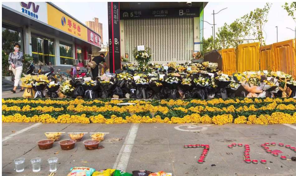
人们在郑州地铁5号线入口处摆上鲜花、蜡烛，纪念在洪水中逝去的遇难者。