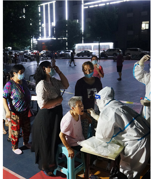
左、郑州，在一条被洪水淹没的道路上跋涉的民众。右、郑州24小时进行全员核酸检测。