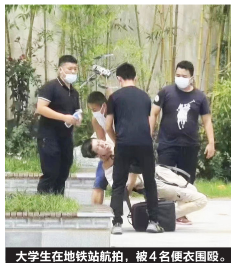
大学生在地铁站航拍，被4名便衣围殴。