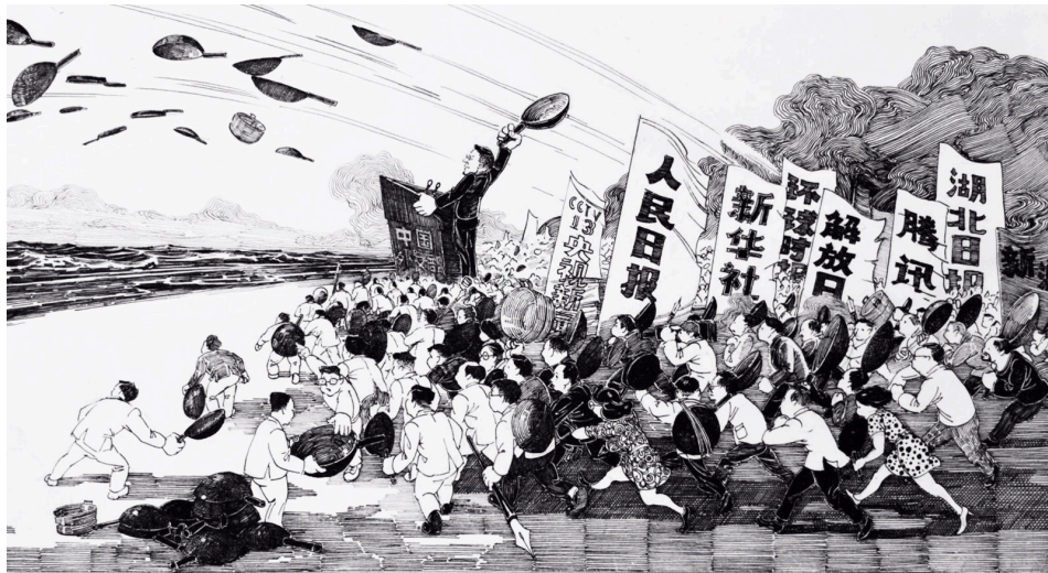
漫画《甩锅》(网络截图)

中共百年刚过，即遭遇两大灰犀牛。郑州水患推责天灾，善后未尽，南京变种疫情再起，可谓祸不单行。