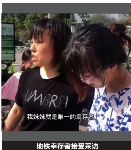
地铁幸存者接受采访