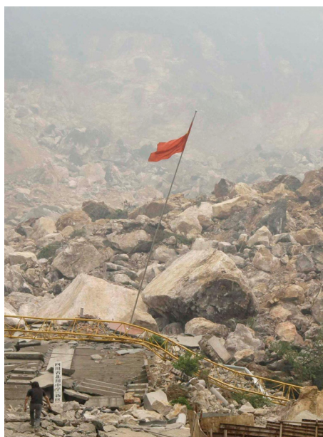
2008年，在汶川地震中倒塌的北川中学。