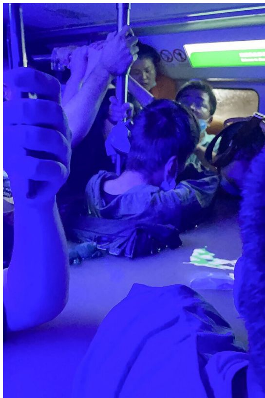
2021年7月20日，郑州，洪水涌入地铁。

“地铁里的水已经到了胸口，氧气基本上已经被吸光了，整个胸腔都在痛。我爸休克好几次神志不清，我一会儿确认我爸怎么样了，一会又去拉拉我妈。”郑州地铁5号线上一位幸存女孩感叹道，“真没想到危险会来得这么突然。”