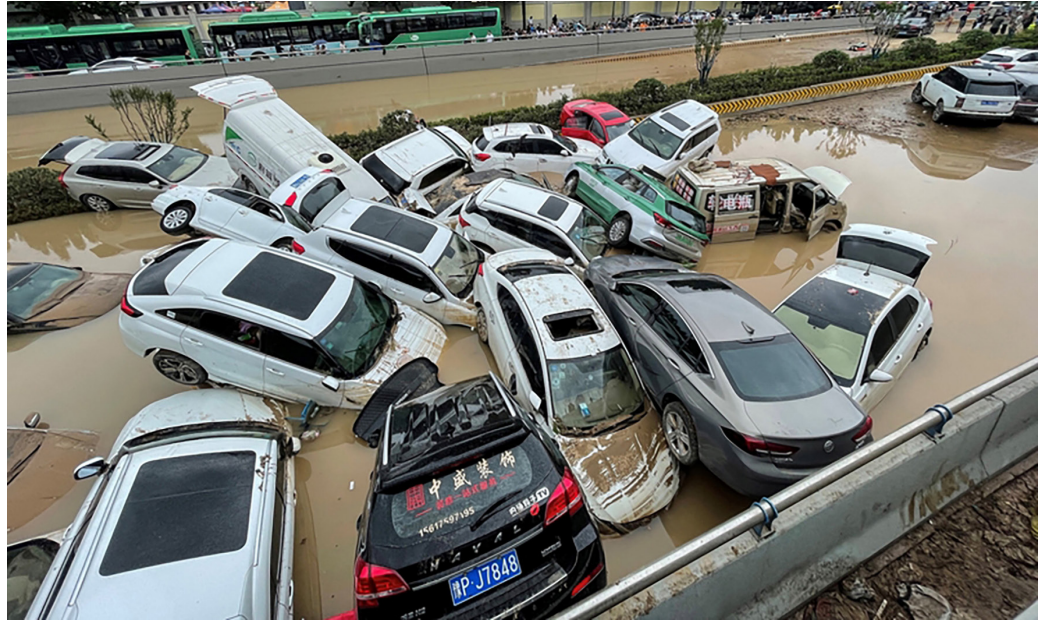
2021年7月21日，河南省郑州市京广隧道口，被洪水冲击在一起的汽车。

河南郑州市7月20日洪灾，被指责有诸多人祸因素。早前视频指，官方在京广路隧道出口设置挡水板，阻断车辆生路。日前又有生还司机公布行车记录仪视频，指控当局在隧道灌水前拦住隧道出口，但不封入口，让车辆“自投罗网”。