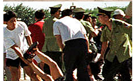
1999年，警察抓捕法轮功学员。