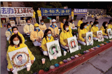
旧金山法轮功学员烛光守夜