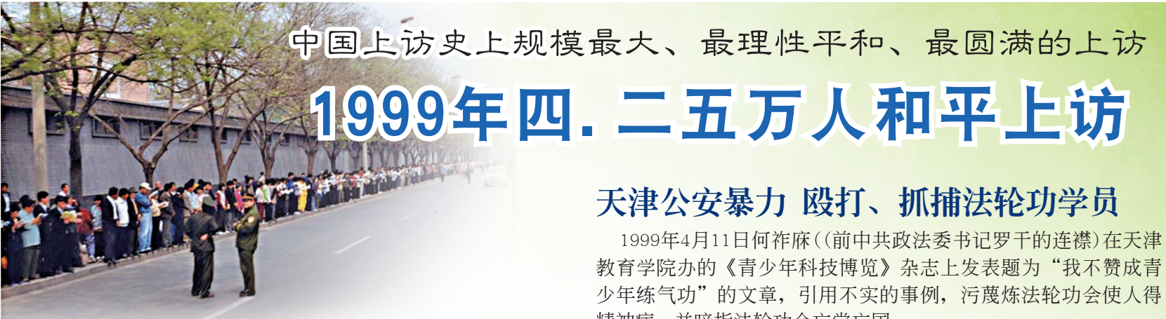
1999年4月25日数万名法轮功学员到中南海附近的中央信访办和平上访，地点为北京俯右街，学员对面的红墙为中南海。大部份学员都在安静读书，整个过程秩序良好，城市交通井然。

1992年5月法轮功由李洪志先生在长春公开传出广受欢迎，启迪人们心灵本有的善根，唤起人们封闭已久的记忆，找回那返本归真之路。至1999年有一亿中国人在学炼法轮功，中共政府部门甚至高层也对法轮功早有正面了解。然而中共是靠严厉控制全民意识形态而维持的政党，唯物主义是中共意识形态的根本；法轮功迅速传播引起中共高度警觉，加上部份官员想利用法轮功制造事端捞取政治资本，对法轮功的骚扰和破坏一直没有停止过。