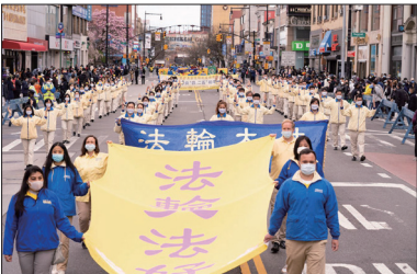
纽约千人游行纪念四.二五和平上访

“四.二五”的和平、理性反迫害精神始终贯穿于法轮功学员讲清真相、唤醒世人的历程中。法轮功学员按照真、善、忍的修炼原则，在“四.二五”中所展示出的巨大道德勇气，浩气长存，就像黑夜中的灯塔，驱散迷雾，照亮航程，为中华民族带来了美好的未来和希望。