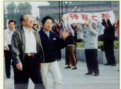
国家体育总局伍绍祖局长视察长春广大群众修炼法轮功的盛况

1992年法轮大法公开传出至1994年，应各地官方气功科学研究会的邀请，李洪志先生在全国23个城市共举办56期法轮功传授班，每期约十天，约六万人次参加。由于法轮功在祛病健身、提升道德方面具有神奇的功效，很多人身心受益从疑难绝症中康复，口耳相传，使法轮功在全国迅速普及。