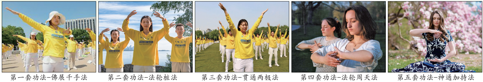
第一套功法-佛展千手法

法轮大法的主要著作《转法轮》浅显易懂，讲出宇宙间最精深的道理，能让人净化身心、返本归真，同化宇宙特性真善忍；是一部指导人如何修炼，如何提高心性，如何做一个好人的书，超越种族文化与宗教藩篱，改变全球上亿人的心灵与命运。被喻为“一部登天的天梯”、“人类史上从未有的万古奇书”“未读《转法轮》做人有遗憾”，这是拜读者发出的敬佩赞叹。