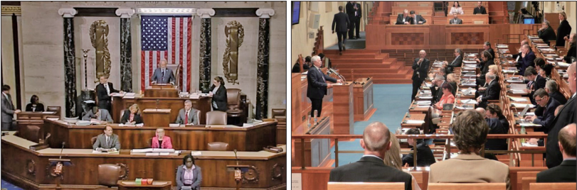
美国国会众议院343决议谴责中共活摘法轮功学员器官

去年有来自欧洲、北美、中东、亚太和拉丁美洲35个国家及地区的920位跨国政要共同签署一份要求中共立即停止迫害法轮功的联合声明。这是多国政要首次全世界大规模联合声援法轮功团体反迫害的行动。加拿大前环境部长，现国会资深议员肯特呼吁国际社会应“更加有力地、公开地谴责中国（中共）政府持续侵犯基本人权的行径”。