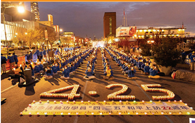
4月18日傍晚部份纽约法轮功学员在中领馆前烛光守夜，呼吁制止迫害。

欢迎浏览相关网站 明慧网 http://www.minghui.org/ 法轮大法 http://gb.falundafa.org/ 2021年4月