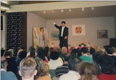
左图:1995年4月李洪志大师在瑞典哥德堡举办了七天的传功讲法班。右图:休士顿市市长宣布1996年10月12日为“休士顿李洪志大师日”。

1995年3月13日李洪志大师受中国驻法大使馆的邀请，在巴黎中使馆文化处举行一场讲法报告会及第一场海外法轮功学习班，法轮功正式走向海外。同年4月14日李洪志大师来到瑞典哥德堡举办了第二场海外法轮功学习班。1996年10月12日在休士顿讲法，当天被休士顿市长宣布为“李洪志大师日”，并被授予“荣誉市民”和“亲善大使”的称号，法轮功开始在世界各地弘传。