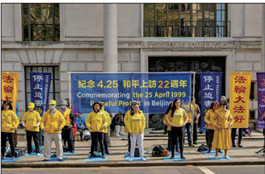
英国法轮功学员在伦敦中使馆前集会