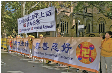
法轮功学员在悉尼市政厅前集会