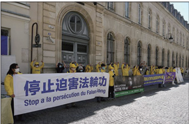
巴黎学员中使馆前集会纪念四.二五