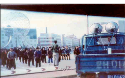
自1999年5月下旬开始全国许多地区法轮功学员的炼功活动受到城管、公安的驱散。一些地区公安用高压水龙头驱赶炼功人群，并用高音喇叭干扰炼功。

做的努力，给政府一个了解实情的机会。他们是在维护按法轮功所教导的“真善忍”做好人的权利，维护正义和良知，展现法轮功学员为争取信仰自由所做的努力。二十多年来不屈不挠、坚持不懈的和平抗争，这种精神正是中华民族获取自由的希望。