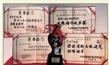
李洪志先生在北京东方健康博览会上获“边缘科学进步奖”“特别金奖”及“最受欢迎的气功师”称号

1992年9月法轮功被确定为中国气功科研会的直属功派。1992年和1993年李洪志先生应邀参加北京东方健康博览会，展现了祛病健身的奇效，引起轰动。1993年赢得大会唯一最高奖项“边缘科学进步奖”，李先生荣获“受群众欢迎气功师”的称号。1993年8月中国公安部中华见义勇为基金会发出《中华人民共和国公安部致中国气功科学研究会感谢信》，对李洪志先生及法轮功的神奇祛病健身功效给予高度肯定。同年12月27日，公安部所属中华见义勇为基金会授予李洪志先生荣誉证书。