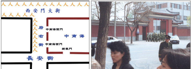
法轮功学员是在员警的调度指挥下从中南海正门沿两边汇集成一圈（四二五上访人群分布示意图，“人”字表示人群所在位置），和上访群众隔街相望的是中南海西门（可以看到紫禁城的红色围墙），无任何围攻中南海迹象。

这就是震惊中外、被称作“中国上访史上规模最大、最理性平和 、最圆满的上访”的四.二五万人上访。