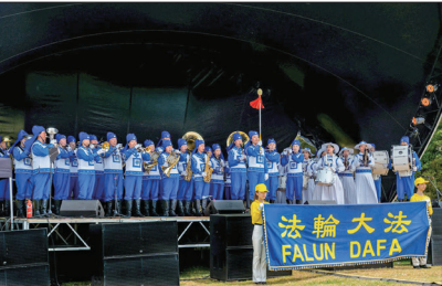
天国乐团在新西兰国庆盛典的舞台上表演