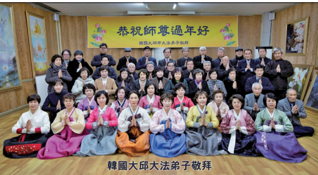
韩国大邱市法轮功学员给师父拜年