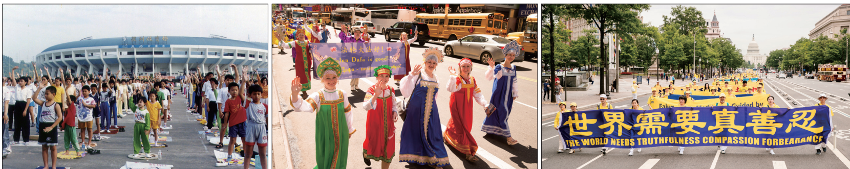
1998年10月深圳三千多名法轮功学员体育馆集体炼功 2017年5月逾万名法轮功学员在纽约举行盛大游行 2018年6月法轮功学员在美国首府华盛顿DC举行反迫害集会游行

印度有超过80所学校的师生在体育课上集体炼法轮功；台湾有数十万人学炼，近千个炼功点遍及全台各县市，各大专院校也成立大法社团。法轮功在台湾受到政府部门及各界的高度肯定！