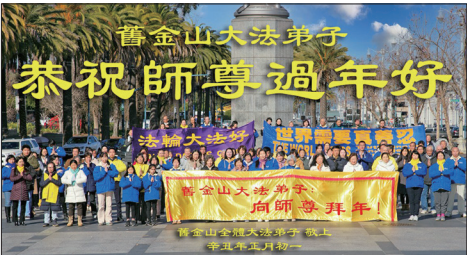
旧金山法轮功学员恭祝李洪志大师新年快乐