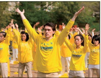
第三套功法-贯通两极法