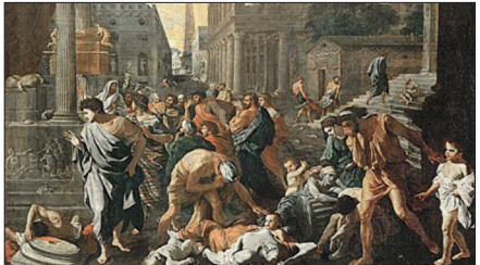
尼古拉斯·普桑“阿什杜德的瘟疫”，描述公元2世纪中叶古罗马安东尼大帝执政时期突然爆发的“安东尼瘟疫”。

明朝末年朝廷面对清军束手无策，兵部六品官员的袁崇焕挺身勇担危局，带兵进驻在山海关北面的宁远，把后金重兵挡在山海关外达二十一年之久。