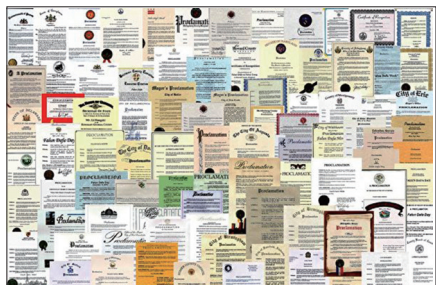
海外各界褒奖及支持信函

法轮功洪传全世界，为各地社会带来可喜的变化，受到各地民众和政府的热烈欢迎。国际社会为表彰李洪志先生和法轮大法对人类身心健康所作出的杰出贡献，至今获得来自全球褒奖3172份，485项支持议案，1232封支持信函。昭显其超越种族、语言与国界的巨大道德感召。