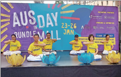
法轮功学员在阿德莱德商业步行街的露天舞台展示功法

1月26日为澳大利亚国庆日，阿德莱德当地改推出一系列小型庆祝活动。1月25日法轮功学员受邀在阿德莱德最繁华的旅游观光购物区兰道商业步行街的商业中心露天舞台上进行功法展示，受到