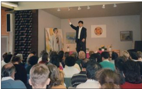
1995年4月李洪志大师在瑞典哥德堡举办了七天的传功讲法班。

1995年3月13日李洪志大师受中国驻法大使馆的邀请，在巴黎使使馆文化处举行一场讲法报告会及第一场海外法轮功学习班，法轮功正式走向海外。同年4月14日李洪志大师来到瑞典哥德堡举办了第二场海外法轮功学习班。1996年10月12日在休士顿讲法，当天被休士顿市长宣布为“李洪志大师日”，并被授予“荣誉市民”和“亲善大使”的称号，法轮功开始在世界各地弘传。