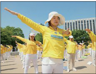
第一套功法-佛展千手法

五套功法简单易学, 适合所有年龄的人, 男女老少皆可炼。法轮功学员义务教功, 不求名利、不收礼、不收费。实践证明法轮大法在把真正修炼的人带到高层次的同时, 对稳定社会提高人们的身体素质和道德水准, 也起到不可估量的正面作用。