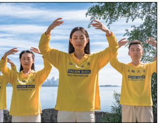
第二套功法-法轮桩法