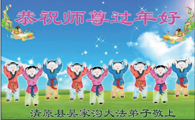
大陸法轮功学员向师父恭祝新年好