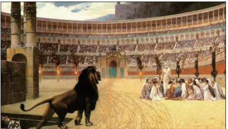
《基督殉道者最后的祈祷》描述古罗马残酷迫害基督教徒的情景：竞技场周围的柱子上左边是遭受火刑的基督徒，右边是十字架处死的基督徒，中间一群基督徒将被猛兽撕碎，而看台上的民众观看着这惨烈的情景。