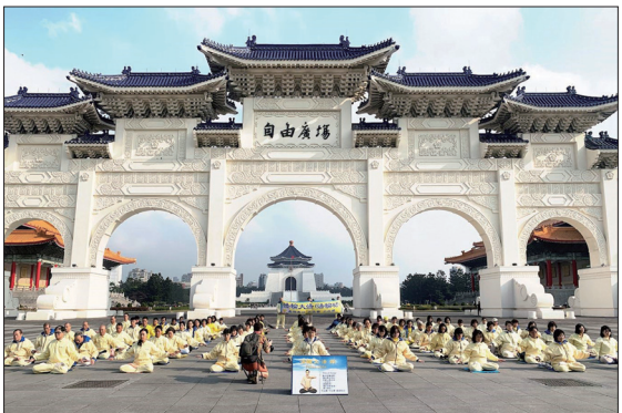
2021年1月16日台湾台北法轮功学员在中正纪念堂的自由广场前集体炼功。

台湾法轮功学员二十几年来在自由广场举办各种各样的炼功及讲真相活动，每次都吸引很多民众来了解和观看。