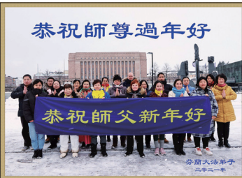
芬兰法轮功学员给师父拜年