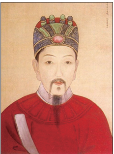
明末抗清名将袁崇焕

今天人类正处在一个历史的巨大转折点上。共产红魔对法轮功修炼者持续多年的迫害，和大疫一样，都成了当今人类选择善恶以及被命运选择的试金石。真心希望有缘人都能够守住心底的善，当历史的这一页翻过后，能够庆幸那美好的未来是因为自己今天作出了正确的选择。