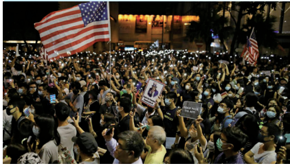
10月14日数万港人在遮打花园集会促请美国尽快通过《香港人权与民主法案》

美国国会众议院10月15日全票通过《香港人权与民主法案》，正等待参议院对其进行表决。若两院投票通过、总统签署成为法律，将成为近30年来美国对香港政策方针的首次重大修订。