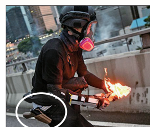
港警腰挂手枪假扮示威者朝香港政府总部扔汽油弹

中共所谓的“暴乱”系中共借港府之手造成。中共的本质决定它不能容忍任何形式的挑战，不允许人民享有自由，不会给人应有的基本人权。时事评论员夏小强说：“中共在香港向全世界展示赤裸裸的暴力，其实是中共政权邪恶本性的大暴露”。中共造假宣传一是为了愚弄国内一部分不了解真相的民众，同时也是为了可能发动的镇压制造借口。此种伎俩在之前的政治运动中被应用多次，属中共流氓特色，其暴力与谎言的邪恶本质从未改变。