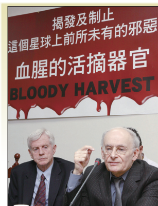
大卫·乔高（左）与大卫·麦塔斯2011年6月28日在台北立法院举行《血腥的活摘器官》中文版新书发表会。

其他如加拿大、比利时、意大利、爱尔兰、捷克、澳大利亚等多国政府部门、机构相继通过决议案制止中共强摘器官的罪行。包括以色列、西班牙、挪威、台湾等颁布相关立法阻止其公民从中国非法获得器官，已有显著成效。