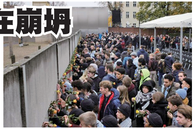
德国民众11月9日举行了柏林墙倒塌30周年纪念仪式

斯坦福大学胡佛研究所资深研究员尼尔·弗格森认为，前苏联为首的社会主义阵营垮台，存在着7大关键因素，分别是：经济增长停滞将导致体制溃烂；中产阶级即使不期望民主也不敢接受空洞口号；腐败、低效和环境恶化是一党制国家的固有特征；再多监视也无法保住一个合法性缺失的政权；在监视状态下人人习惯撒谎，