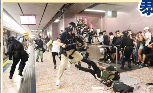
8月31日港警在太子站无差别暴打无辜市民，多名乘客受伤甚至被打到头破血流。