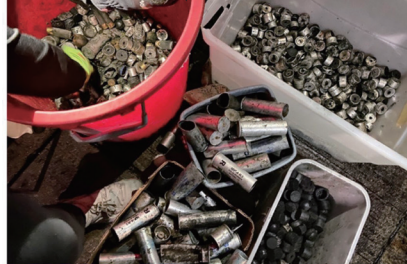
中大校园检获的各种子弹壳共2356枚，用如此火力攻打一间大学创下全球纪录。

从11月11日起港警连续多天发起对香港各大学校园的暴力攻击。港警闯入理工大学、香港大学及中文大学，以及教堂抓人，并在理大及中大校园内发射催泪弹。12日港警再度闯入中大校园，并狂射了2,356枚催泪弹、橡胶子弹，并出动水炮车镇压学生，中大校园内火光及烟雾冲天。大批校友、市民纷纷赶往中大，用车堵住公路形成困兽局，不让警方进一步增援武力，同时运送物资支援学生，仿佛当年“六四”一样。香港大专学界发表联合声明痛斥“魔警屠城”、“重演六四”。