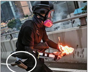
港警腰挂手枪假扮示威者朝香港政府总部扔汽油弹

中共所谓的“暴乱”系中共借港府之手造成。中共的本质决定它不能容忍任何形式的挑战，不允许人民享有自由，不会给人应有的基本人权。时事评论员夏小强说：“中共在香港向全世界展示赤裸裸的暴力，其实是中共政权邪恶本性的大暴露”。中共造假宣传一是为了愚弄国内一部分不了解真相的民众，同时也是为了可能发动的镇压制造藉口。此种伎俩在之前的政治运动中被应用多次，属中共流氓特色，其暴力与谎言的邪恶本质从未改变。