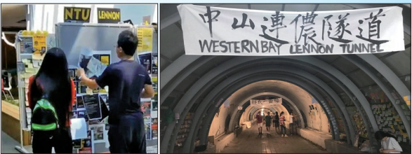
左图：来台观光的中国籍李姓夫妻撕毁台湾大学校内连依墙所贴海报，被台湾移民署强制出境并管制5年内不得再入境。右图：中山大学因学校布告栏声援反送中学条遭陆客破坏，学生会宣布将“撕一贴百”，将连依墙扩及到中山大学隧道。

法治的社会，不容许这些不法的事情发生；未来将研拟相关人员在入境时，进行一定程度的管制，让法治社会的治安得以维持。