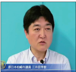
原日本松本市議員 三井田孝歐

日本前议员三井田孝欧表示，看到现在中共在全世界活动，目睹中共暴政后反感的日本人在增加，但日本人真正反感的并非中国人，而是反感中共。中共倒台才会使中华民族的文化复兴，并使大家幸福，使全世界人民幸福。他相信只有当前更多中国人，意识到中共不正，并退出共产党才会使世界和平。“许多中国人想要获得自由，三退就是最好方式，他支持退党运动”。