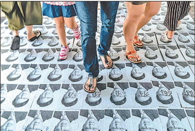
何君尧照片被铺地上任人踩

香港亲共议员何君尧被外界认为是7.21元朗恐袭幕后黑手，不断爆出丑闻和涉及种族灭绝等语言暴力，英国安格里亚鲁斯金大学10月28日宣布撤销何君尧荣誉博士学位的决定。何君尧和香港特首林郑月娥被曝都是中共地下党员，其中何君尧被曝早在1984年就加入中共成为党员。有网民发起呼吁英国取消林郑家人的英国国籍的徵签，已有超过13万人响应。