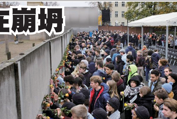
德国民众11月9日举行了柏林墙倒塌30周年纪念仪式

澳大利亚汉学家、历史学家白洁明说，发生在香港中文大学的港警和学生之间的暴力冲突，是北京为了达到搞乱香港社会、直接控制香港的目的，而指挥港警故意制造的冲突。还有专家披露，中大碧秋楼是“香港网络要塞”，这或许是警方执意要闯入香港中文大学的原因。