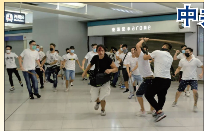
数百名白衣人在元朗西铁站殴打市民

香港不同业别人士包括公务员、教育界、金融界、法律界、医护界、会计界、银发族等纷纷走上街头。大批香港年轻人更是走在最前线奋死抗争，据警方通告，目前被拘捕的2,000多人中40%是年轻人，10%更是15岁以下的孩子。香港年轻人背着写好的遗书，抱着被打被捕被自杀的危险也要上街捍卫民主自由。