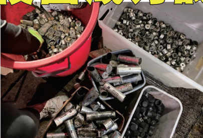
中大校园检获的各种子弹壳共2356枚，用如此火力攻打一间大学创下全球纪录。

港警把校园变成战场的暴行，遭到美国、英国、日本、台湾等各地政要以及美、英政府的谴责。美国资深参议员与参议院多数党领袖麦康奈尔将《香港人权与民主法案》提交参议院审议，并启动“热线”机制，《香港人权与民主法案》提交后6小时内没有参议员反对的话，就当作参议院一致通过，法案就会随即交到白宫处理。英国外交部官员首次表示，英国要实