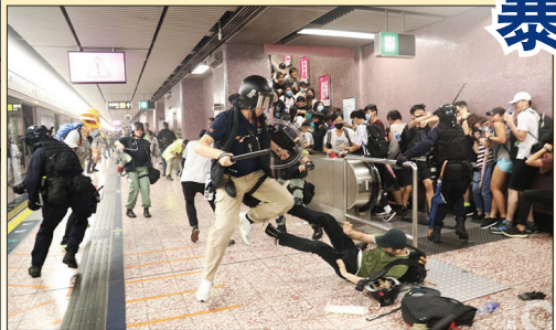
8月31日港警在太子站无差别暴打无辜市民，多名乘客受伤甚至被打到头破血流。