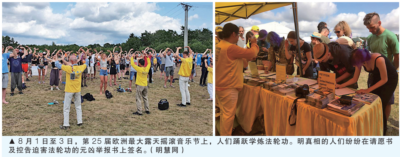
▲8月1日至3日，第25届欧洲最大露天摇滚音乐节上，人们踊跃学炼法轮功。明真相的人们纷纷在请愿书及控告迫害法轮功的元凶举报书上签名。（明慧网）

【大纪元讯】8月1日至3日，第25届欧洲最大露天摇滚音乐节于波德边境小城Kostrzyn市的奥得河畔开幕，吸引了十几万来自世界各地的摇滚音乐爱好者，他们自带帐篷安营扎寨在宽阔的山坡树林中。波兰法轮功学员已经是连续第4次参加该音乐节活动，向来自世界各地的年轻人及民众介绍法轮功，受到热烈欢迎。 当法轮大法炼功音乐在空中响起时，“是法轮大法吗？我可找到你们了。”“法轮功的音乐真好听，打入我的脑中，打