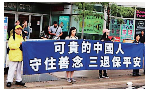
▲2019年9月28日，加拿大多伦多部份法轮功学员声援3亿4千万中国勇士退出中共邪党组织。

共产党的“老祖宗”马克思，早年曾经是基督徒，后来加入魔鬼撒旦教。撒旦教崇拜恶魔，与神为敌，是以破坏神的教诲、毁灭人性和人类为目的的一个邪教组织。1848年，马克思在共产党的第一份纲领文件《共产党宣言》的开篇就向世界宣布：共产主义是一个“幽灵”。这个幽灵显然就是撒旦的幽灵，是个邪灵。