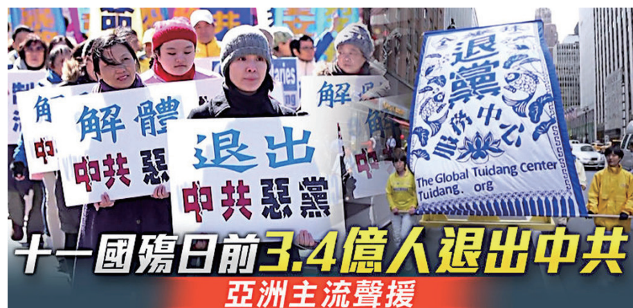
▲中共十一 70 周年前夕，不但全球各地掀起反共大潮，中国民众也累计有 3 亿 4 千多万人退出中国共产党及其附属组织。（视频截图）

是如何蔑视、和剥夺基本人权与自由的，2019 年 10 月 1 日是中共暴掠国家 70 年的窃国日，自中共统治中国 70 年间，有 8 千万中国人非正常死亡，我向退出中共的 3 亿 4 千万志同道合者致敬，只有中共灭亡，中国民众才能享有自由。”