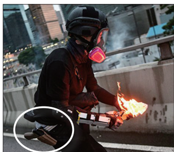
港警腰挂手枪假扮示威者朝香港政府总部扔汽油弹

针对香港“反送中”活动，中共媒体最初一律噤声，对国内严密封锁消息，后来又集中造谣，展开舆论攻势，配合官方的“暴乱”、“港独”、“恐怖主义苗头”等定性抹黑抗议民众。中共公然制造假新闻，或移花接木，或凭空捏造，或扭曲事实，充分自曝其丑。