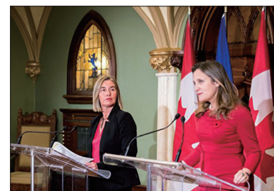
欧盟外交和安全政策高级代表费德里卡·莫盖里尼（左）和加拿大外长方慧兰（右）发表联合声明，支持维护香港的自由和自治。

香港紧张局势问题。澳大利亚总理莫里森不认同中共港澳办形容香港出现恐怖主义苗头，他期望香港特首林郑月娥细心以和平方式解决现时的严峻局面。8月17日欧盟外交和安全政策高级代表费德里卡·莫盖里尼和加拿大外长方慧兰发表联合声明，支持维护香港的自由和自治。加拿大总理特鲁多提到香港局势，再次呼吁各方保持克制和尊重人权，他不想进一步升级加拿大和中国之间的贸易与外交争端，但加政府要捍卫自己的利益，也无意向中共退让。8月9日英国外交大臣多米尼克·拉布致电林郑月娥，表示英方支持香港的高度自治，强调和平抗议的权利。