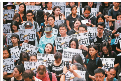
香港教师反送中游行高喊守护下一代