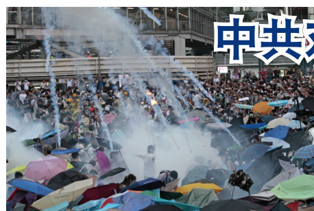
警方发射催泪弹暴力驱赶市民

8月30日香港警方抓捕多位参与“反送中”的社运人士和议员，引发国际强烈谴责，香港民主派议员和民众表示不会退缩。同一天，路透社一篇报道披露，林郑曾向北京提议正式撤回修订“引渡法案”，但被中共否决。至此中共以港府为傀儡、破坏“一国两制”、无视民众利益，以维护极权统治为出发点，不择手段制造恐怖的面目已暴露无遗。