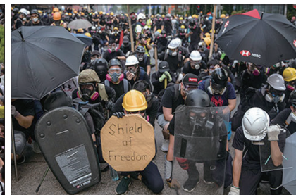
面对警方清场示威者毫不畏惧

经历两月有馀的血雨腥风，中共是个什么东西，给港人留下了刻骨铭心的记忆，因为中共的狰狞面目在他们面前已经暴露的淋漓尽致。从此以后港人不会再相信“一国两制”、“五十年不变”等谎言，为了香港的将来港人会抗争到底。