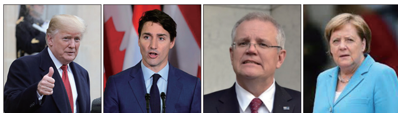
多国领袖政要发声关注香港情况，左起：美国总统川普、加拿大总理特鲁多、澳大利亚总理莫里森、德国总理默克尔。

香港紧张局势问题。澳大利亚总理莫里森不认同中共港澳办形容香港出现恐怖主义苗头，他期望香港特首林郑月娥细心以和平方式解决现时的严峻局面。8月17日欧盟外交和安全政策高级代表费德里卡·莫盖里尼和加拿大外长方慧兰发表联合声明，支持维护香港的自由和自治。加拿大总理特鲁多提到香港局势，再次呼吁各方保持克制和尊重人权，他不想进一步升级加拿大和中国之间的贸易与外交争端，但加政府要捍卫自己的利益，也无意向中共退让。8月9日英国外交大臣多米尼克·拉布致电林郑月娥，表示英方支持香港的高度自治，强调和平抗议的权利。