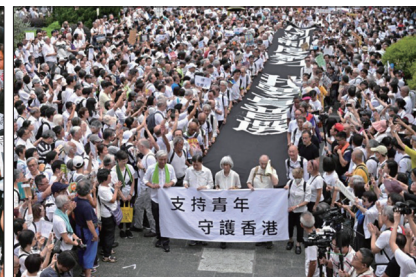
银发族声援年轻人抗争守护香港自由