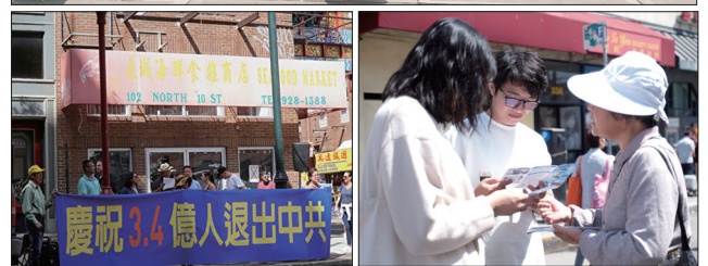
上图：马来西亚退党服务中心与民众一起声援3亿3千5百万三退勇士，吸引民众观看。