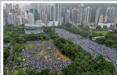
8月18日170万港人冒雨在中环遮打花园“流水式”集会

今年2月13日香港政府宣布修订《逃犯条例》，该修订案一旦通过，所有在港人士、世界上很多国家人士无论过境香港或来此旅游、求学、工作，都有可能被中共藉由《逃犯条例》移送中国大陆审判，生命安全和人权自由就得不到保障。