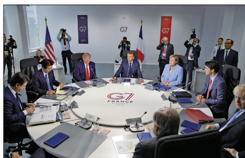
七国首脑联合肯定《中英联合声明》

8月26日七国集团峰会（G7）在法国落幕，七国领导人（美、加、英、德、法、日和义大利）支持在1984年《中英联合声明》中规定的香港自治权，同时呼吁各方保持冷静。