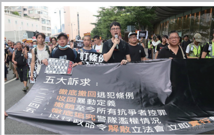
市民上街要求撤回修例等五大诉求