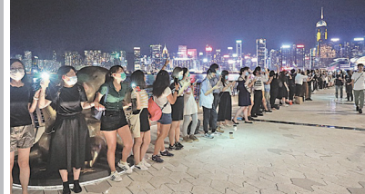
8月23日晚港人仿效30年前“波罗的海之路”抗争运动发起“香港之路筑人链”活动，21万人在港铁荃湾线、观塘线及港岛线30多个车站外组成共40多公里长的人链。