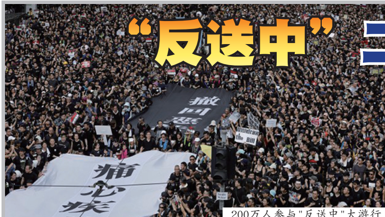
200万人参与“反送中”大游行