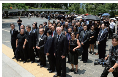
不同业别人士包括公务员、教育界、金融界、法律界、医护界、会计界、大专学界人士各行业纷纷走上街头抗争。图为法律界3000人游行。