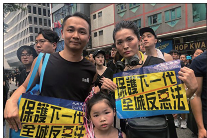
许多香港父母为保护下一代站出来