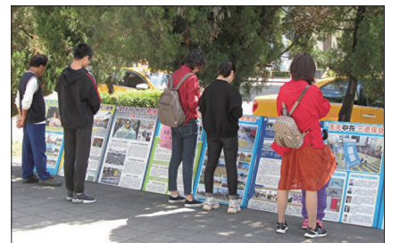
台北故宫的真相展板

“我们不信法轮功，也不信共产党。”夫妻俩要去大直，可是不知方向。她为他们详细说明指出路线。临别时这对夫妻深有感触地对她说：“原来你们炼法轮功的真的这么善良，我们信你们了。”老太太没入过党团队，老先生则取化名退了党，然后两人高兴地离开了。