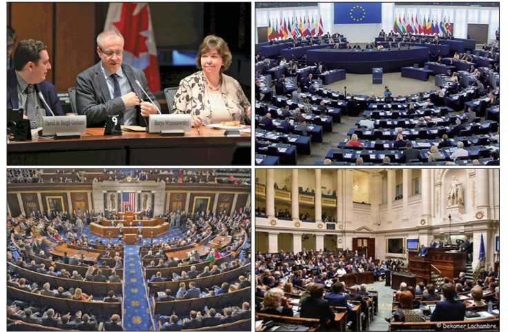
左上：加拿大自由党国会议员鲍瑞斯·瑞兹纽斯科基在国会听证会上用“当今时代最黑暗的罪恶”来形容中共强摘人体器官。右上：欧洲议会主席宣布制止强摘器官的48号书面声明。

其他如比利时、意大利、爱尔兰、捷克、澳大利亚等多国政府部门、机构相继通过决议案制止中共强摘器官的罪行。包括以色列、西班牙、挪威、台湾等颁布相关立法阻止其公民从中国非法获得器官，已有显著成效。