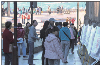
悉尼歌剧院前中国游客被真相展板吸引

澳大利亚悉尼歌剧院是世界闻名的旅游景点，一辆辆满载着大陆游客的大巴停在剧院附近的麦觉理街，在通向歌剧院的必经之路上有一堵巨大的岩石墙，墙上有近十米长的横幅链，横幅上的真相内容深深吸引着他们。