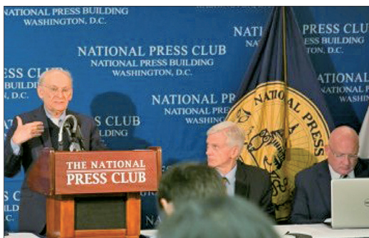
活摘器官最新调查报告新闻发布会