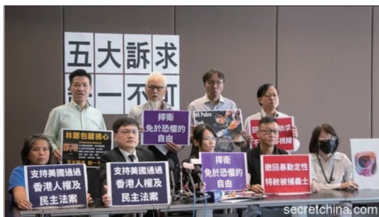
“全港反送中联席”强调警方滥用暴力问题严重，须成立独立调查委员会，才能解决困局。

由逾40个民间团体及专业团体组成的“全港反送中联席”，9月5日回应特首林郑月娥“撤回”《逃犯条例》修订草案，他们表示，经过两个多月的抗争，有市民受到严重伤害，现时撤回“已经太迟”，“难以接受”，谴责林郑是在虚假回应，并重申“五大诉求 缺一不可”，呼吁港府