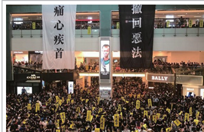
8月5日香港民间反送中发起罢市、罢工、罢课活动及七区集会，要求港府回应市民五大诉求。图为沙田新城市广场的集会。