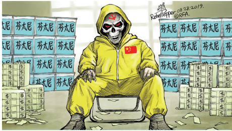
▲ 中国是芬太尼的源头。（自由亚洲电台专栏变态辣椒）

【大纪元讯】美国弗吉尼亚州的执法官员8月29日表示，破获一个在美国多州贩毒的团伙，逮捕了35名毒贩，及近30公斤的芬太尼和海洛因，警方估计，光是这些芬太尼就足以让1,400万美国人毙命，一旦流入市场后果不堪设想。据美联社报导，这一案件的破获正值美国加大力度打击来自中国的芬太尼之际。