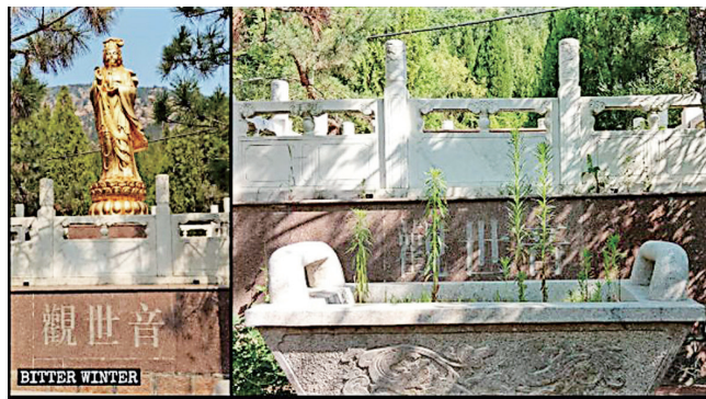
▲ 6月21日，山东省青岛市崂山著名的大悲禅寺中的观音像遭政府强拆。

报导披露，山东省已有多座寺庙被强拆为残砖败瓦，庙里的佛像被推倒压毁，还将包括寺院住持在内的僧人全部驱逐。槐子寺位于山东临沂市，建于2016年，香火旺盛，被中共当局以“非法占地”为名拆除。