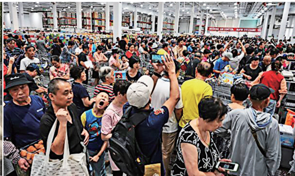
▲ 8月27日，美国Costco在上海开幕，人潮挤爆。

让不断煽动反美情绪的中共官方被狠狠打脸，有网民讽刺：中共的新闻联播天天骂美国白骂了。