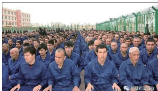
22个国家的大使向联合国人权委员会递交连署信要求中共停止在新疆地区大规模拘留维吾尔人

“我们呼吁中国（中共）坚持其国家法律和国际义务，尊重人权和基本自由，包括新疆和中国各地的宗教或信仰自由。”