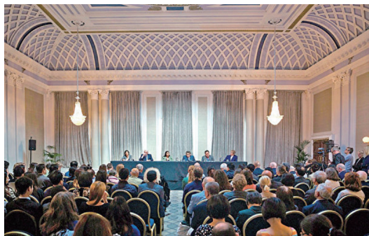
国际独立“人民法庭”于6月17日在伦敦宣判结果，判定中共活摘良心犯器官的行为仍然存在，法轮功学员是器官供应的最主要来源。

法庭估计，在中国每年进行多达9万次移植手术。而中共官方给出的数据远低于此。有人呼吁英国议会禁止英国患者前往中国进行移植手术；来自各个党派的50多名国会议员支持这项议案。以色列、意大利、西班牙和台湾已经实施了此类限制。