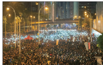
深夜抗议人群不仅未散去，依然大声疾呼撤回恶法、要求特首林郑月娥下台。

香港反送中游行得到全世界的关注，全球各大媒体纷纷进行报道。各界人士发声给予支持，全球纷纷举办集会跨海挺香港声援活动。