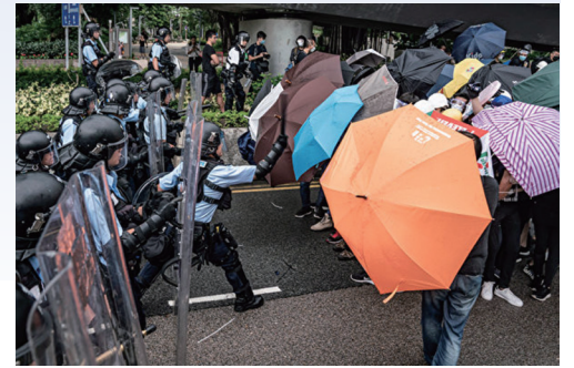
香港示威者举起雨伞抵制警察抓捕

中共70年对大陆的统治，充分显现了其残暴和无耻。尽管它不断变换花招，施展欺骗和利诱的伎俩，但是，越来越多的人已经认清了中共的本质，敢于明确地抵制共产暴政。此次香港游行再度暴露中共邪恶本质从未改变。