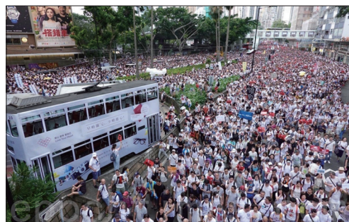
6月9日香港民间人权阵线发起反恶法大游行，有103万人参与游行。

3月31日民间人权阵线（简称“民阵”）举办首次反修例（发起“反送中”、反恶法大游行。）游行，1.2万人参加。4月3日，香港立法会为修例进行首读，并成立法案委员会详细审议。4月28日民阵举行第2次反修例游行，13万人参加。5月20日港府要求立法会绕过法案委员会在6月12日直上大会审议条例。