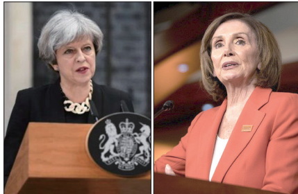
左:英国首相特雷莎·梅 右:美国国会众议院议长佩洛西

美国国会众议院议长佩洛西6月11日发表声明，批评修订《逃犯条例》，显示中共明目张胆地践踏香港法治的企图，压制异议并扼杀港人自由。英国首相特雷莎·梅在12日议会说，该修订方案必须尊重1984年《中英联合声明》所规定的权利和自由。