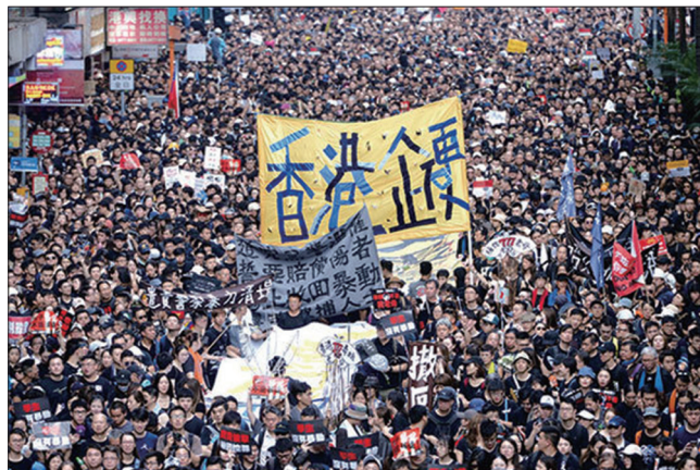
香港人口约740万人，6月16日却有近200万人(约27%)走上街头反抗送中条例。

香港特首林郑月娥低头是香港人民的胜利。当然，如果没有全世界正义力量的支持和声援，要取得这样的胜利也是不可能的。所以，这同时也是全世界正义力量的胜利。这个胜利打破了中共不可能被推倒的神话，为大陆人民争取民主自由树立了可靠的榜样。