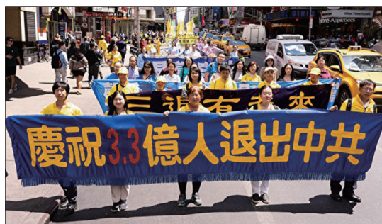
逾万名法轮功学员纽约集会 声援3.3亿人三退

中共建政近70年，施行暴政导致八千多万中国人死于非命；2004年大纪元发表系列社论《九评共产党》，系统揭示了中共的真实历史与邪恶流氓本质，令海内外华人震惊，引发波澜壮阔的三退(退党、退团、退队)大潮。