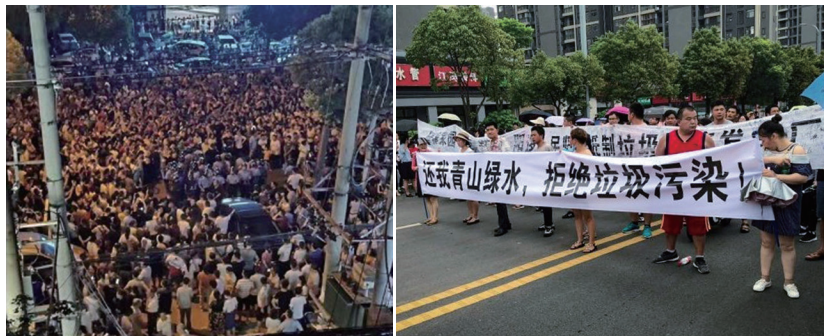
湖北省武汉市郊的新洲区阳逻街道居民多次走上街头，抗议兴建垃圾焚烧炉。

据了解，当地有一座已运行十余年的陈家冲垃圾填埋场，臭气熏天，造成的污染已无法估量，政府却要在填埋场原址偷建垃圾焚烧发电厂，周边民众闻讯后群起抗议。自抗议事件爆发以来，当地媒体集体噤声，政府方面极力封锁消息，微博、抖音等视频被迅速删除，微信群、QQ群大量被封杀。