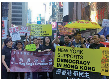
纽约港人聚集在时代广场声援香港反“送中”法律

美国总统川普在6月12日首度就此发表意见。他说，他相信这次游行真的有100万人，这是他见过最大规模的抗议行动。他了解香港人抗议的理由，希望这个问题能获得妥善解决。