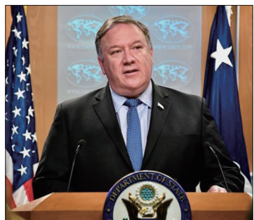
美国国务卿蓬佩奥在2018年度《国际宗教自由报告》发布会上讲话

6月3日美国驻华使馆微博发布2016年通过的《全球马格尼茨基人权问责法》相关介绍。法律规定，实施人权迫害的官员和打手均可受到美国政府的制裁，制裁方式包括限制其签证以及冻结其在美国资产等。