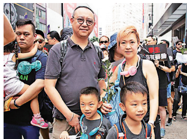
▲6月16日，邱生邱太带着6岁双胞胎兄弟游行。

“反送中”抗争不但促使香港与台湾民众更加团结反共，6月9日，全球12个国家、29个城市也纷纷举行反送中集会，声援香港的百万游行抗议活动，包括美国纽约、加拿大温哥华、英国伦敦、澳大利亚墨尔本、德国柏林、日本东京、台湾台北、法国巴黎、丹麦哥本哈根等。6月16日下午，上万名在台香港学生及台湾民间团体在立法院群贤楼外举行“616撑香港，反送中”活动，声援香港民阵发起的616反送中大游行，谴责港府暴力侵犯香港人权。◇