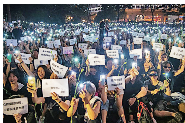
▲6月14日，6千名香港妈妈们不满林郑月娥“母亲论”，在遮打花园集会抗议。

访时表示：“因为送中条例通过的话，香港的法治会彻底沦陷。中共统治的大陆是一个草菅人命的社会，共产党的政权是极度残暴、极度无耻，根本不讲自由民主和法治。如果我们今天不站出来反抗，香港这块最后的阵地都无法坚守的话，那我们就是任人宰割。我们今天站出来反抗，至少我们今天还有争取胜利的希望。”◇