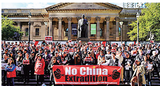
▲6月9日，澳大利亚民众游行集会声援香港反送中。

《苹果日报》报导称，北京已意识到香港正面临一场空前危机，不仅影响到特区政府的管治，也影响到北京的颜面。主管香港事务的国务院副总理兼中央港澳工作