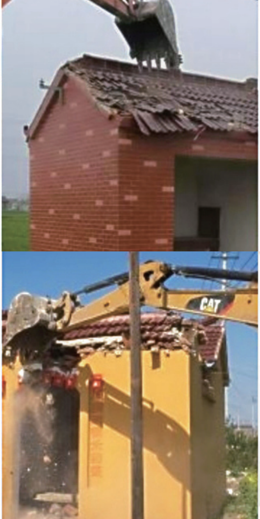
▲近期江苏高邮市大规模强拆近6千座土地公庙，引发舆论谴责。

江苏高邮市实施的大规模强拆土地庙事件，近日引发网络舆论关注。网民“绮罗香士”认为：土地爷是一个小地方维持乡间稳定和秩序的“看不见的手”。十个村官，顶不上一个土地爷！有网民表示：“土地官职虽小，但能保一方人畜平安康泰。难道只能信仰你红教，其他信仰不能有，看来