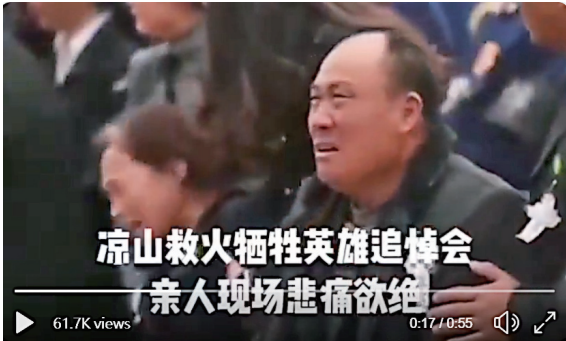
▲四川凉山3月30日发生森林火灾，31名消防员遇难。追悼会上家属悲痛欲绝。（影片截图）

对这次山火灾难及中共官方高调举行的悼念英雄活动，网民纷纷热议。有网民说，中共到处大撒币，“根本不把钱用在提升灭火器具和手段的升级换代上。人死了，大摆排场，大办丧事，隆重肃穆，好像很舍得的样子。”这次山火灾难也引发网络聚焦中共的英雄观。网民们说，“英雄是亲人的泪与血，我们不要英雄，失火常见，几次大火，错误的指挥，把年轻士兵的生命当炮灰，我们不