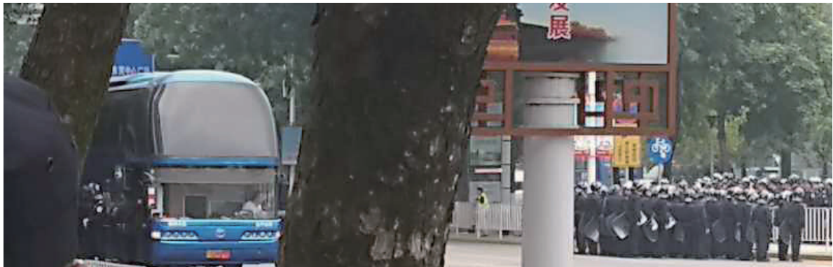
▲4月6日，来自大陆各地的大批团贷网出借人聚集在东莞讨说法，当地政府如临大敌，调动数千警力进行镇压。

4月6日，来自大陆各地的大批团贷网出借人聚集在东莞讨说法，当地政府如临大敌，调动数千警力进行镇压，维权者被分流到不同的地方之后遣返。这是此平台自3月28日爆雷以来，一次最大规模的维权行动。