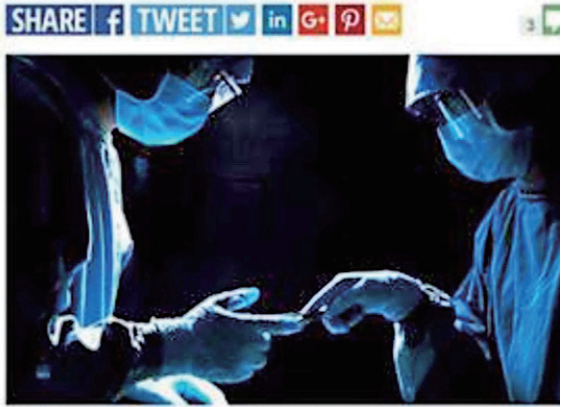
▲2019年3月31日，大卫·威廉姆森（David Williamson）在《周日快讯》（Sunday Express）报纸和网站上发表文章〈活动人士警告中（共）国屠杀政治犯以取器官〉。（网站部分截图）

By DAVID WILLIAMSON Published: 13:42, Sun, Mar 31, 2019 | Updated: 14:45, Sun, Mar 31, 2019