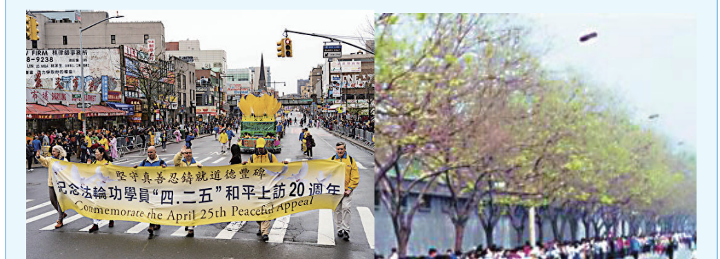
▲ 2019年4月20日，上千名法轮功学员在纽约游行和集会纪念“4.25”20周年。