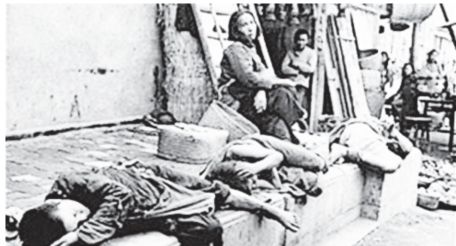
▲经过了大放“粮食卫星”和“大炼钢铁”等的大跃进，中国人民在 1959 到 1961 年经历了古今中外史无前例的大饥荒，3 年大饥荒饿死人数超过 4 千万。

在那时，从城市到乡村不少人得了浮肿病，已很难找到气色好的人，“胖子”成了珍稀动物。