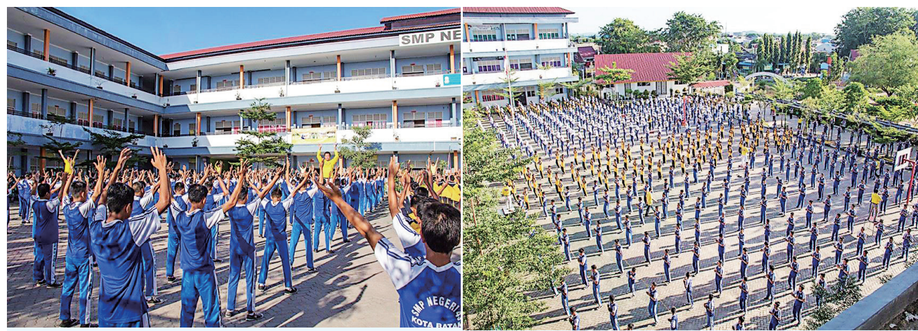
▲ 2019 年 1 月 12 日，印尼巴丹岛第 43 国立中学师生约 800 人在大操场集体学炼法轮功。（明慧网）

2019 年 1 月 12 日，印尼巴丹岛法轮功学员再次来到第 43 国立中学，向学生与老师们介绍法轮功的功法。大约 8 百名国中生聚集在学校大操场一起学炼法轮功。法轮功学员展示功法动作，并介绍了法轮功的特点以及真、善、忍修炼原则。炼完功之后，一位社会学老师表示：“音乐能帮人集中注意力，感受到正的能量，身体感觉清爽。”一位学校警卫说：“动作柔和，身体放松，音乐平静。”有的老师表示自己炼功之前小臂有点酸，炼完之后身体感觉很舒服。◇