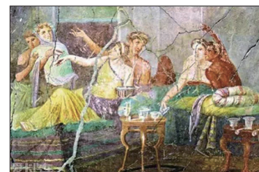
沉迷于酒色的男女—庞贝壁画

唯有解体这些党思维，才能从中共的思想绑架中解脱出来，并能窒息中共的邪恶，唯有回归正统的中华传统文化，中国人才能真正的走向自由、走向光明。