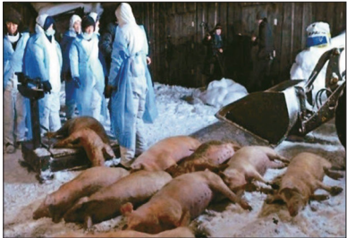
非洲猪瘟在中国多个省市蔓延，疫情难以控制。

自8月初大陆首次出现非洲猪瘟以来，仅中共官方通报，截至12月20日，共有包括上海、北京、天津、重庆4直辖市在内的23个省份57个市（区、盟）发生了98起家猪疫情、2起野猪疫情。累计扑杀生猪超过63万头。中共官员承认，疫情防控困难，并且是长期难以解决的问题；同时非洲猪瘟已广泛进入食物链。