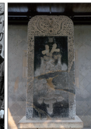
康熙写的兰亭碑在文革时遭到破坏。