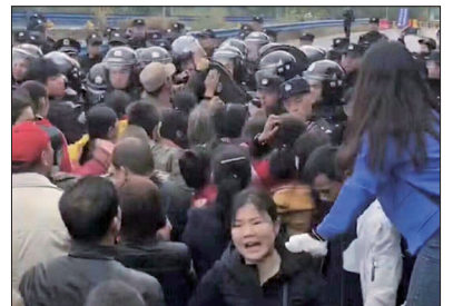
湖北黄冈市浠水县巴河镇上万村民上街游行，抗议建垃圾焚烧发电厂。

自11月6日起连续多日，湖北黄冈市浠水县巴河镇上万村民上街游行抗议在当地建设垃圾焚烧发电厂，却遭警察镇压。上万村民无奈于10日上街游行、堵高速国道，抗议在当地建设垃圾焚烧发电厂，希望引起各界关注。大批警察镇压，村民被抓被打。