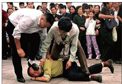
1999年7月时任中共党魁江泽民发动对法轮功群体的长达19年的疯狂迫害，再次重创中国社会道德人心。

传统文化以儒、释、道思想为根，中共破坏文化的第一步就是清除他们在世间的具体体现一宗教。中共建政之初三教齐灭，并对中国人强行灌输无神论思想，扭曲人们心中的正信。毁寺焚经，并采用自己组建由共产党领导的所谓佛教、道教和基督教、天主教来排挤、取代和变异原本的宗教，从而达到控制宗教进而消灭宗教的目地。