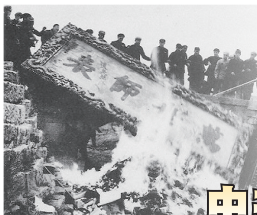
文革时孔庙中的“万世师表”匾被烧为灰烬