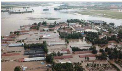
暴雨袭击期间，上游三大水库又同时泄洪导致山东寿光多个村庄被淹没。

8月18、19日山东多地连降暴雨，因山东潍坊政府判断错误，且未发泄洪通知，让上游冶源、黑虎山、嵩山三座水库同时大量泄洪，造成寿光50多个村庄遭到严重水灾，最少十几人死亡，上万亩房屋受损，农田、蔬菜大棚及养殖场等产物淹没，数万头猪死亡。千万农家一夜倾家荡产，有的农民因此绝望而自杀。当地民众怨声载道。寿光市多名村民表示，他们都不知道政府发过泄洪通知，“政府连过问都没有，更不要说补偿了。”