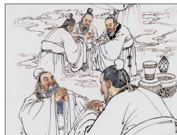
中华民族被称为礼仪之邦，不同身份、不同环境有不同的礼仪。

中华传统文化中贯穿“天、道、神、佛、命、缘、仁、义、礼、智、信、廉、耻、忠、孝、节”等，“天人合一”的宇宙观；“善恶有报”是社会的常识；“己所不欲，勿施于人”为人美德；“忠孝节义”处世标准；“仁义礼智信”规范人和社会的道德基础。中华文化体现出诚（实）、善（良）、和（为贵）、（包）容等优点。“天地君亲师”的牌位，反映出百姓敬神（天地）、忠社稷（君）、重家庭（亲）、尊师道的根深蒂固的文化内涵。在这个文化教育出来的人，都是最善良的好人，被世界尊称为礼仪之邦。