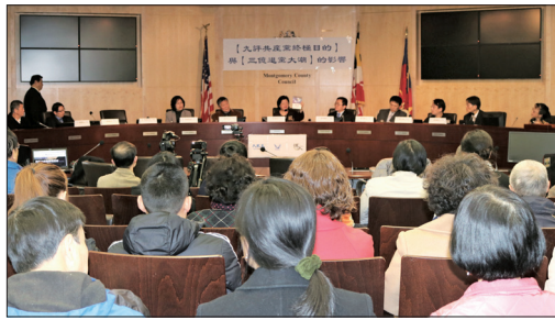
2018年2月3日在美国大华府地区马里兰州洛克维尔市蒙郡举行的研讨会上，多位中国问题专家探讨了《共产主义的终极目的》新书与近三亿人退出中共给中国和世界带来的影响。

《共产主义的终极目的——中国篇》是继《九评共产党》之后的又一宏篇巨制，自2017年11月在大纪元新闻网首发，赢得广大读者的赞誉。有网友说，“《九评共产党》就像九把斩妖利剑，斩了红魔共产党；《共产主义的终极目的》就像金色的阳光，将彻底解体中共邪灵。”