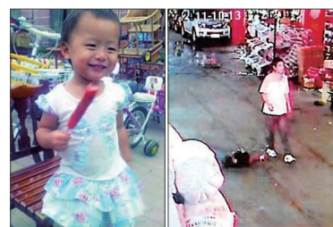
2011年10月13日，2岁女童小悦悦先后被两辆汽车撞伤倒地，但路过的18名行人都冷漠以对。小悦悦最后抢救无效离世。

翻开报纸每天都可看到大量假冒伪劣、坑蒙拐骗、见死不救、吸毒、谋财害命，官员淫乱层出不穷的报道。官场腐败几乎到了无官不贪的地步，腐败之风蔓延到军队、司法、医疗、教育、体育、传媒、国企等社会各层面。广东佛山发生小悦悦被汽车碾压18个路人见死不救；老人跌倒缺失信任造成的“扶不起”；毒疫苗各种有毒食品问题频出就是明证。