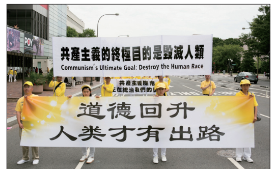
2018年6月20日法轮功学员在美国华盛顿DC举行盛大游行，打出“道德回升，人类才有出路”的横幅。

彻底解体共产邪党，清理人间的共产主义邪恶因素，回归传统，重建人类应有的文化、道德、信仰体系，找回人与神联系的心路，是人类归正的需要，生命才有希望！