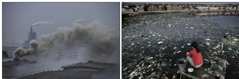
中国各地环境污染持续恶化，导致出现一系列癌症村。左图为绍兴滨海工业区染料厂的烟囱冒出滚滚浓烟；右图为被污染的广东省贵屿镇河流、水塘。

以水资源为例，目前中国五万公里河流有四分之三以上鱼类无法生存。中共环保部2014年3月公开的信息也显示2.8亿居民饮用水不安全。15年前大批污染企业从沿海城市迁到重庆、西安等上游城市，导致中国长江、黄河等几大水源严重污染，影响面超过全国人口的90%。