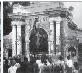
以千部子弟为核心的清华大学红卫兵，拆毁了清华的标志性建筑——二校门。