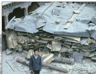
文革中西藏大昭寺被破坏之后，贵金属被收集起来运出西藏。