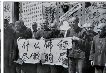
哈尔滨市的极乐寺被红卫兵捣毁，红卫兵勒令僧人举着“什么佛经尽放狗屁”的横幅在寺院门前示众。