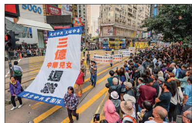
香港声援三亿人三退大游行