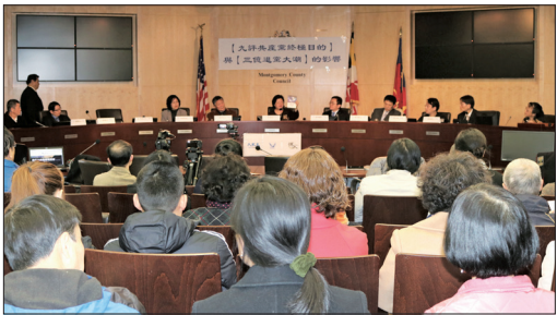
2018年2月3日在美国华府地区马里兰州洛克维尔市蒙郡议举行的研讨会上，多位中国问题专家探讨了《共产主义的终极目的》新书与近三亿人退出中共给中国和世界带来的影响。

《共产主义的终极目的一中国篇》是继《九评共产党》之后的又一宏篇巨制，自2017年11月在大纪元新闻网首发，赢得广大读者的赞誉。有网友说，“《九评共产党》就像九把斩妖利剑，斩了红魔共产党；《共产主义的终极目的》就像金色的阳光，将彻底解体中共邪灵。”