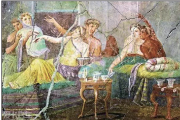
沉迷于酒色的男女—庞贝壁画

唯有解体这些党思维，才能从中共的思想绑架中解脱出来，并能窒息中共的邪恶，唯有回归正统的中华传统文化，中国人才能真正的走向自由、走向光明。