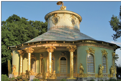
16~18世纪欧洲掀起中国热

唐朝传统文化鼎盛时恰是中华国力鼎盛时期，当时欧洲、中东、日本等地都派人至长安学习，周边国家则以中国为宗主国。上图：《东征传绘卷》描绘日本遣唐使乘船赴唐的景象。