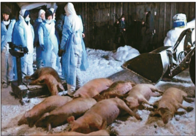
非洲猪瘟在中国多个省市蔓延，疫情难以控制。

自8月初大陆首次出现非洲猪瘟以来，仅中共官方通报，截至12月20日，共有包括上海、北京、天津、重庆4直辖市在内的23个省份57个市（区、盟）发生了98起家猪疫情、2起野猪疫情。累计扑杀生猪超过63万头。中共官员承认，疫情防控困难，并且是长期难以解决的问题；同时非洲猪瘟已广泛进入食物链。