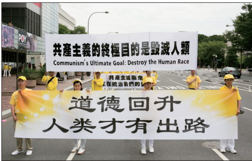
2018年6月20日法轮功学员在美国华盛顿DC举行盛大游行，打出“道德回升，人类才有出路”的横幅。

彻底解体共产邪党，清理人间的共产主义邪恶因素，回归传统，重建人类应有的文化、道德、信仰体系，找回人与神联系的心路，是人类归正的需要，生命才有希望！