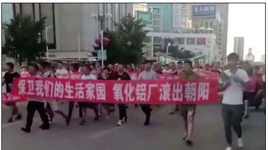
朝阳数万市民上街游行抗议，逼停当局欲成立的氧化铝项目。

8月1日辽宁朝阳数万市民在市政府、公安局前聚集；上街游行，抗议当局欲成立氧化铝项目。当局最终被迫取消该项目。据了解，该项目需大量水资源，但朝阳本就十年九旱，生活用水都费劲；而项目要建在水资源旁边。民众抱怨，锦州、别的城市都赶走的项目朝阳要接受，关键离水资源太近！还污染空气。