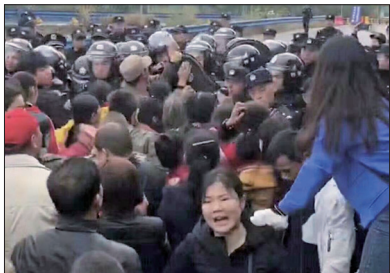
湖北黄冈市浠水县巴河镇上万村民上街游行，抗议建垃圾焚烧发电厂。

自11月6日起连续多日，湖北黄冈市浠水县巴河镇上万村民上街游行抗议在当地建设垃圾焚烧发电厂，却遭警察镇压。上万村民无奈于10日上街游行、堵高速国道，抗议在当地建设垃圾焚烧发电厂，希望引起各界关注。大批警察镇压，村民被抓被打。