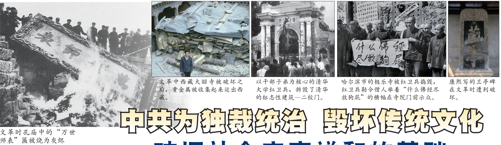
文革时孔庙中的“万世师表”匾被烧为灰烬