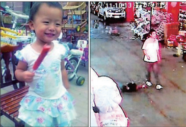
2011年10月13日，2岁女童小悦悦先后被两辆汽车撞伤倒地，但路过的18名行人都冷漠以对。小悦悦最后抢救无效离世。

翻开报纸每天都可看到大量假冒伪劣、坑蒙拐骗、见死不救、吸毒、谋财害命，官员淫乱层出不穷的报道。官场腐败几乎到了无官不贪的地步，腐败之风蔓延到军队、司法、医疗、教育、体育、传媒、国企等社会各层面。广东佛山发生小悦悦被汽车碾压18个路人见死不救；老人跌倒缺失信任造成的“扶不起”；毒疫苗各种有毒食品问题频出就是明证。