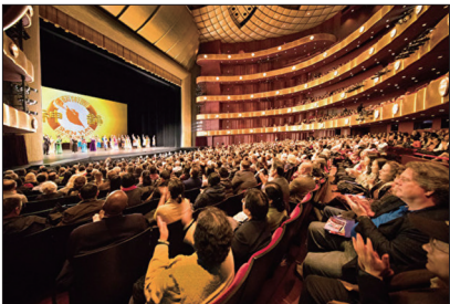
神韵艺术团复兴中华传统文化

1945年联合国成立时在总部的大门口竖立一块石碑，刻着孙中山先生手书的“孔子礼运大同篇”。西方有学者说“礼运大同篇”是人类最早最优秀的人权宣言。