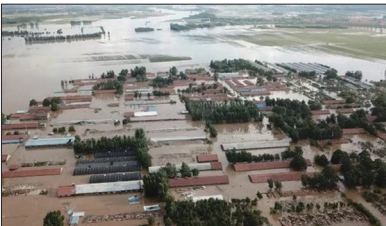
暴雨袭击期间，上游三大水库又同时泄洪导致山东寿光多个村庄被淹没。

8月18、19日山东多地连降暴雨，因山东潍坊政府判断错误，且未发泄洪通知，让上游冶源、黑虎山、嵩山三座水库同时大量泄洪，造成寿光50多个村庄遭到严重水灾，最少十几人死亡，上万亩房屋受损，农田、蔬菜大棚及养殖场等产物淹没，数万头猪死亡。千万农家一夜倾家荡产，有的农民因此绝望而自杀。当地民众怨声载道。寿光市多名村民表示，他们都不知道政府发过泄洪通知，“政府连过问都没有，更不要说补偿了。”