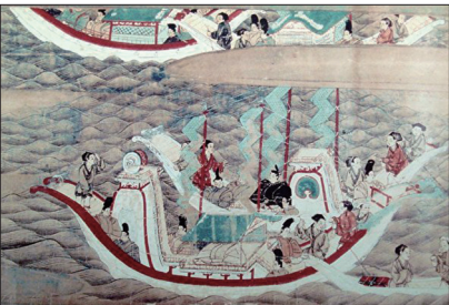
唐朝传统文化鼎盛万国来朝

唐朝传统文化鼎盛时恰是中华国力鼎盛时期，当时欧洲、中东、日本等地都派人至长安学习，周边国家则以中国为宗主国。上图：《东征传绘卷》描绘日本遣唐使乘船赴唐的景象。