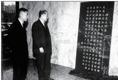
联合国成立时竖立礼运大同篇石碑

在法国带动下欧洲出现“中国热”，拥有瓷器、丝绸等成为宫廷贵族身份的象徵，中国画亦成为法国艺术家模仿的对象。上图为普鲁士无忧宫中的中国茶亭。