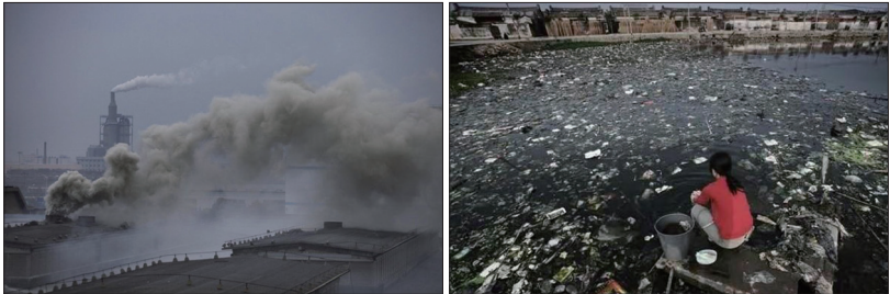
中国各地环境污染持续恶化，导致出现一系列癌症村。左图为绍兴滨海工业区染料厂的烟囱冒出滚滚浓烟；右图为被污染的广东省贵屿镇河流、水塘。

以水资源为例，目前中国五万公里河流有四分之三以上鱼类无法生存。中共环保部2014年3月公开的信息也显示2.8亿居民饮用水不安全。15年前大批污染企业从沿海城市迁到重庆、西安等上游城市，导致中国长江、黄河等几大水源严重污染，影响面超过全国人口的90%。