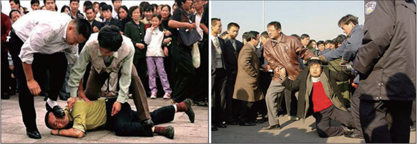
1999年7月时任中共党魁江泽民发动对法轮功群体的长达19年的疯狂迫害，再次重创中国社会道德人心。

传统文化以儒、释、道思想为根，中共破坏文化的第一步就是清除他们在世间的具体体现一宗教。中共建政之初三教齐灭，并对中国人强行灌输无神论思想，扭曲人们心中的正信。毁寺焚经，并采用自己组建由共产党领导的所谓佛教、道教和基督教、天主教来排挤、取代和变异原本的宗教，从而达到控制宗教进而消灭宗教的目地。