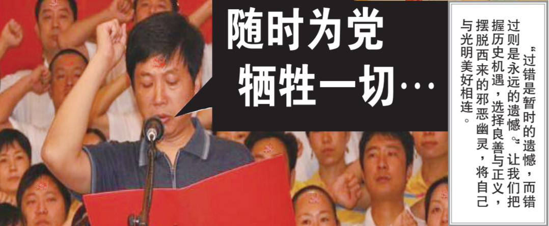
▲入中共党团队要举拳过肩发誓，说的是要随时为党牺牲性命，而且永远不背叛中共。这个誓言一出，就是一件极其可怕的事情。

思在自己的一首诗中说得十分清楚：“我年轻的双臂已充满力量，我要握住并抓碎你——人类。”因此，中共夺取政权以后，不间断地发动各种各样血腥的整人、杀人运动，使八千万无辜的中国人丧命。1999年以来，江泽民流氓集团与中共又疯狂打压信仰“真、善、忍”的法轮功修炼民众。中共是一个以斗争为