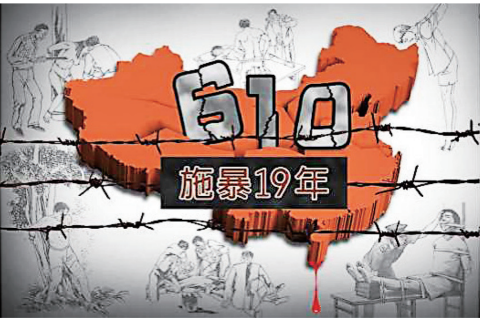
▲“610”是中共内部的重点保密单位。

“610”是中共内部的重点保密单位。1999年6月，中共前党魁江泽民为避开《宪法》和正常法律程序，在中共中央成立了一个专职镇压法轮功的非法机构——“中共中央处理法轮功问题领导小组”，下设办公室，也称“610办公室”。