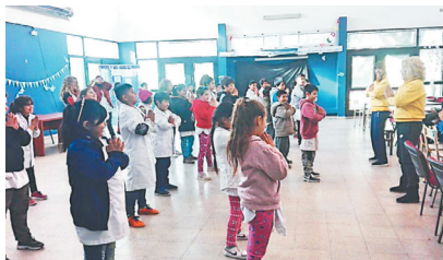
▲2018年7月13日，布宜诺斯艾利斯的法轮功学员在索拉诺镇的一所学校教授孩子们法轮功功法。