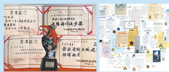
▲来自国内与国际对法轮功与李洪志先生的部分褒奖与支持信函。