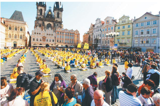
▲2018年9月28日，法轮功学员在布拉格市中心老城广场举行大型集体炼功，各国游客围观。

2018年9月28日，捷克首都布拉格，阳光普照，来自欧洲35个国家约1千5百多名的部分法轮功学员在市中心举行了集体炼功、盛大游行及烛光排字等活动。