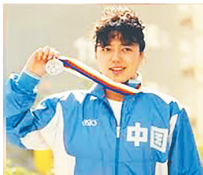
▲前奥运名将黄晓敏档案照。(视频截图)