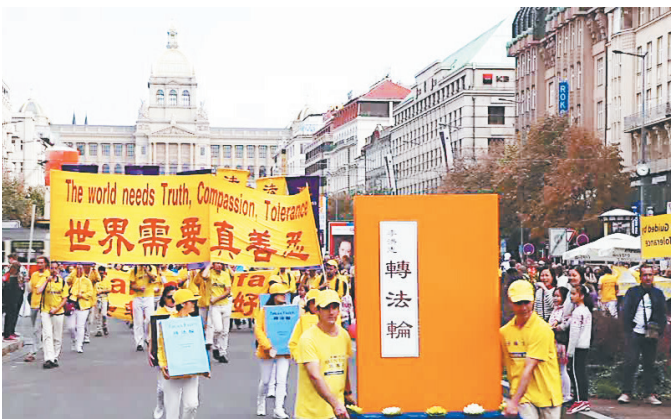
▲2018年9月28日，法轮功游行队伍浩浩荡荡穿过布拉格老城中心，行人驻足观看。