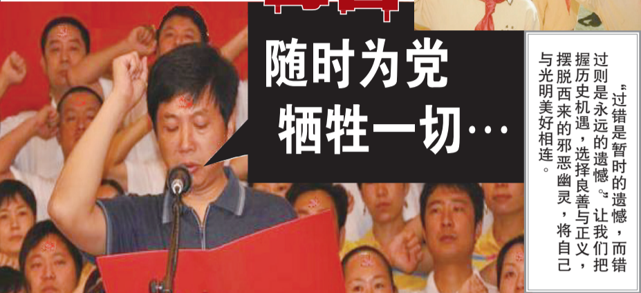
▲ 入中共党团队要举拳过肩发誓，说的是要随时为党牺牲性命，而且永远不背叛中共。这个誓言一出，就是一件极其可怕的事情。