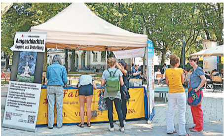
▲ 2018年7月7日，部份法轮功学员在德国西南边陲Lörrach市的商业步行街设立法轮功信息台，向中西方人士讲述真相。

共产党的“老祖宗”马克思，早年曾经是基督徒，后来加入魔鬼撒旦教。撒旦教崇拜恶魔，与神为敌，是以破坏神的教诲、毁灭人性和人类为目的的一个邪教组织。1848年，马克思在共产党的第一份纲领文件《共产党宣言》的开篇就向世界宣布：共产主义是一个“幽灵”。这个幽灵显然就是撒旦的幽灵，是个邪灵。