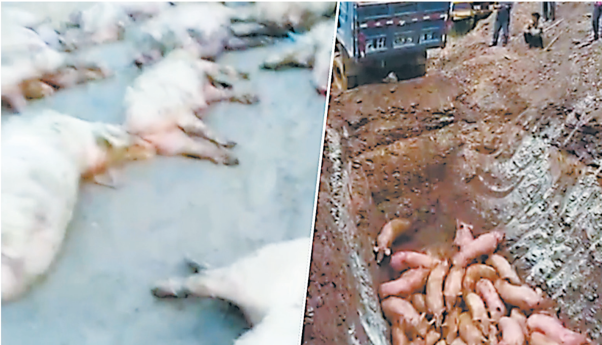
▲图为沈阳爆发非洲猪瘟，染病猪只死亡率100%。当局实施封锁，民众则感到恐慌。

美国农业部长珀杜（Sonny Perdue）表示，中国对非洲猪瘟疫情的报导不足，没曝