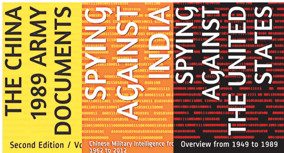
▲ 《中国密档》系列中，其中三本书的封面。

中共内部绝密文件，介绍了中共军队于1989年3月在西藏戒严，最后却成为几个月后天安门广场镇压的样板的过程。