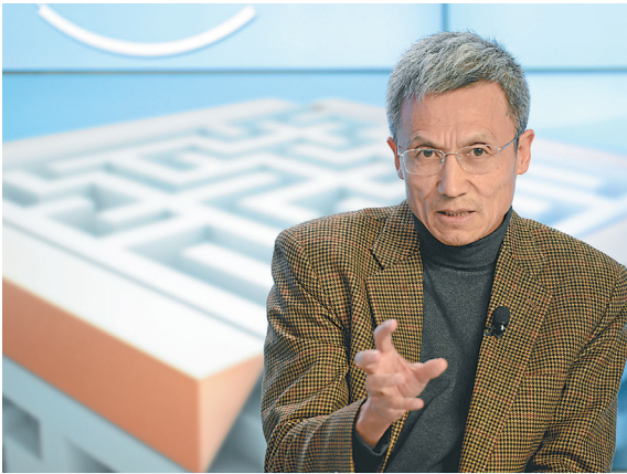
▲中国大陆经济学家许小年最近在演说中曝光大陆经济的真实情况。图片摄于 2013 年 1 月 23 日瑞达沃斯论坛。（维基公有领域）