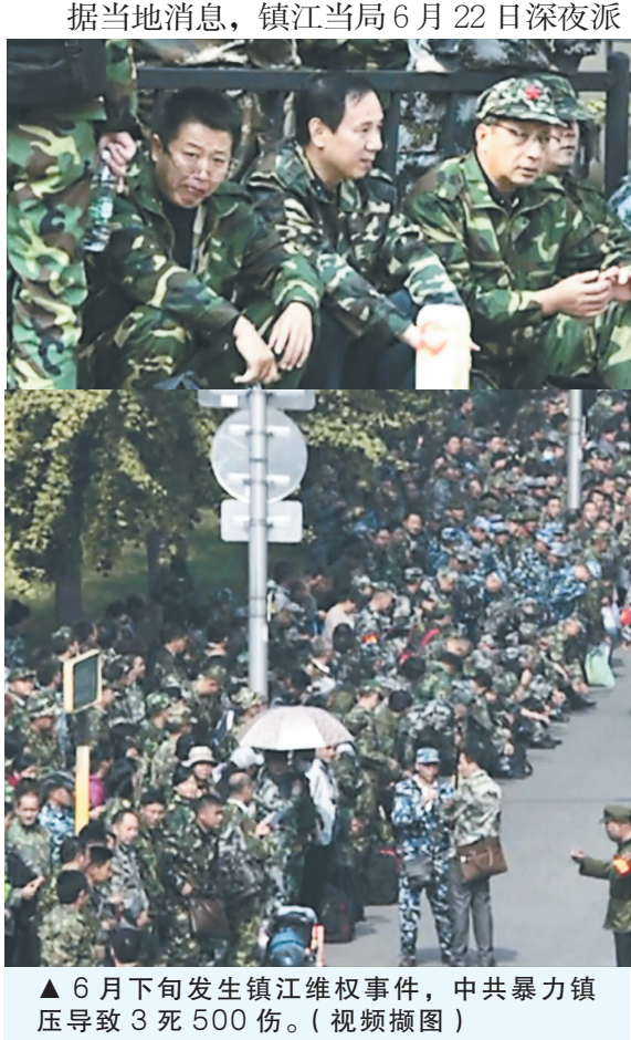
▲ 6 月下旬发生镇江维权事件，中共暴力镇压导致 3 死 500 伤。（视频截图）

从 6 月 19 日开始，江苏省镇江市大批退伍军人齐聚市政府，老兵们没有政治要求，只是三点经济要求：“老有所养、病有所医、死有所理。”结果不仅没有得到响应，反而遭到未穿制服的不明身份人员殴打、袭击和镇压。