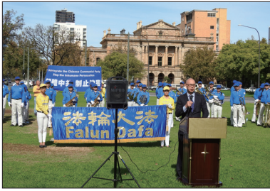
澳洲阿德莱德游行集会声援三退大潮