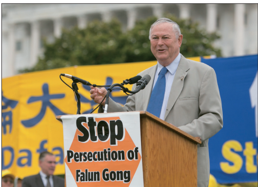
美国联邦众议员罗拉巴克发起932号决议案

号和416号提案，声援中国人三退。932号决议案是第三次以决议案形式声援三退，目前已提交众议院外交事务委员会。