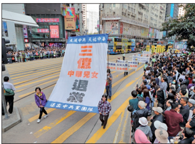
香港集会游行庆祝三亿人退出中共