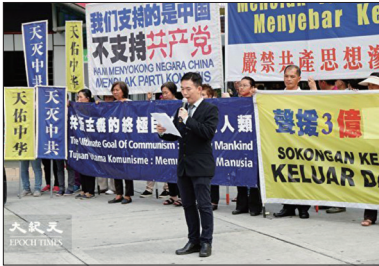
马来西亚声援三亿人三退集会