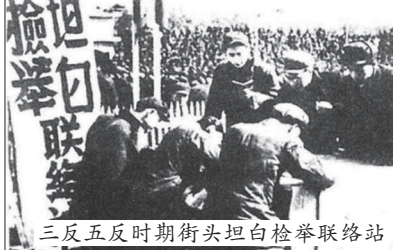
三反五反时期街头坦白检举联络站