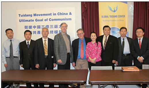
“三亿中国人三退”研讨会在美国国会举办

5月9日下午，在美国国会举办的“三亿中国人三退”研讨会上，来自不同国家的政治家和中國问题专家表示，民众大规模的精神觉醒为中国的未来带来了光明的希