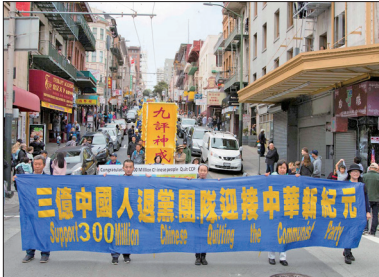
旧金山游行集会声援三亿人三退