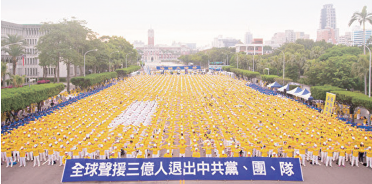
4月22日台北游行集会声援三亿人退出中共

3月11日约十万观众在纽约布鲁克林第八大道观看法轮功学员的游行，分为法轮大法好、停止迫害法轮功和三退保平安三个主题。全球退党服务中心义工在现场帮500多人办理三退。