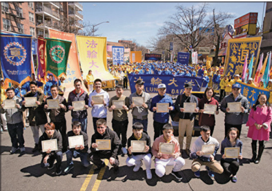
2018年4月22日全球退党中心主席颁发三退证书给18位公开三退的华人