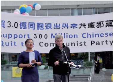
新西兰奥克兰举行庆祝三亿人三退活动