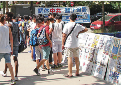
在巴黎的埃菲尔铁塔附近的法国退党服务中心帮助游客三退