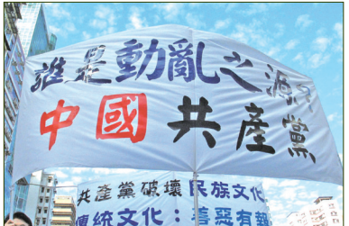
香港举行声援中国三退大潮游行中的横幅

中共这个西来幽灵对中华民族犯下累累罪行，是一个与中国传统价值格格不入的党，是一个践踏人性、通过谎言蛊惑人心窃取政权的党，是一个一直在欺骗和屠杀中国人的党。中共是一个不光彩的党，注定将被民众、世界和历史所抛弃。