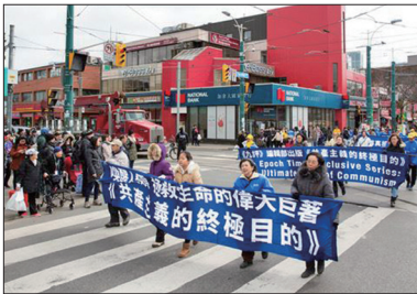
多伦多大游行声援三亿人抛弃中共