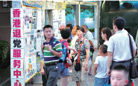
许多大陆游客透过香港的真相退党点声明退出中共组织