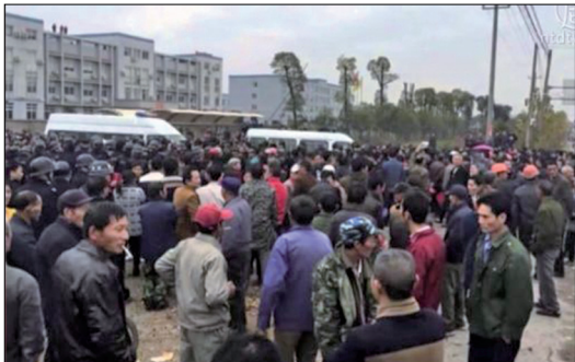
哈尔滨市向阳镇上千村民长期饱受亿丰垃圾处理厂的污染，愤而抬着棺材堵路维权。

目前当地政府承诺停止垃圾处理厂运营，村民抱持观望态度，如果继续倾倒垃圾，他们将再次发起大规模维权。