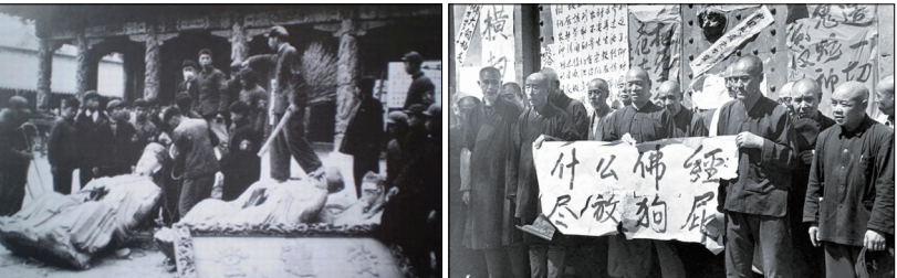
左:文革中孔庙被焚毁;右:红卫兵捣毁哈尔滨极乐寺,和尚被逼拉标语自辱。

中华传统文化博大精深、源远流长，以儒释道思想为根、信仰为本、道德为尊，贯穿着“天、道、神、佛、命、缘、仁、义、礼、智、信、廉、耻、忠、孝、节”和“天人合一”的宇宙观。百姓敬神（天地）、忠社稷（君）、重家庭（亲）、尊师道。知晓“善恶有报”“己所不欲，勿施于人”。中华文化体现出诚（实）、善（良）、和（为贵）、（包）容等优点。儒、释、道信仰给中国人建立一套非常稳定的道德体系，是社会赖以存在、安定和谐的基础。