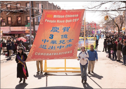
3月11日近千名法轮功学员在纽约举行盛大游行