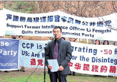
前中共国安部对外谍报官李凤智在华盛顿DC的大使馆前公开声明退党