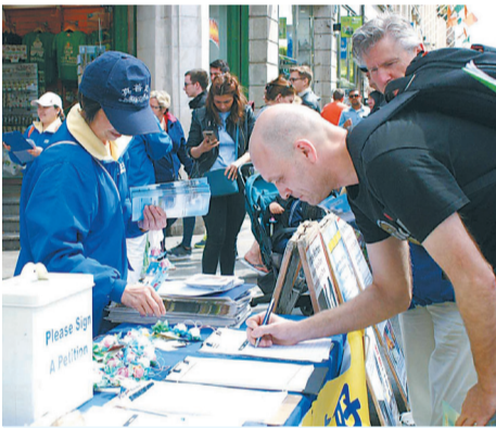
▲ 民众签名支持法轮功学员反迫害。

共产党的“老祖宗”马克思，早年曾经是基督徒，后来加入魔鬼撒旦教。撒旦教崇拜恶魔，与神为敌，是以破坏神的教诲、毁灭人性和人类为目的的一个邪教组织。1848年，马克思在共产党的第一份纲领文件《共产党宣言》的开篇就向世界宣布：共产主义是一个“幽灵”。这个幽灵显然就是撒旦的幽灵，是个邪灵。