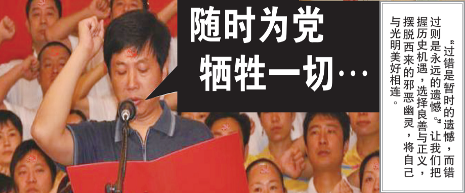
▲ 入中共党团队要举拳过肩发誓，说的是要随时为党牺牲性命，而且永远不背叛中共。这个誓言一出，就是一件极其可怕的事情。