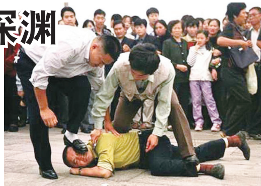
公安在天安门殴打和平请愿的法轮功学员

因迫害而膨胀的公权力大肆打压无辜百姓，疯狂掠夺民众财富，官员腐败成风，整个社会正气越来越少，歪风盛行。民间冤怨遍地，抗暴浪潮风起云涌，