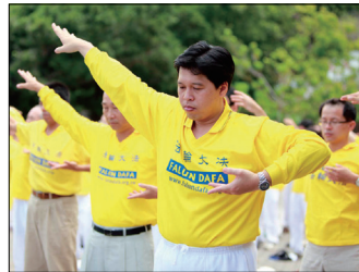
第一套功法-佛展千手法

实践证明法轮大法在把真正修炼的人带到高层次的同时，对稳定社会、提高人们的身体素质和道德水准，也起着不可估量的正面作用。