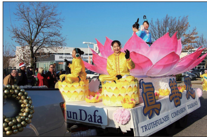
多伦多法轮功团体参加七个城市的圣诞游行，受到中西方观众的欢迎。