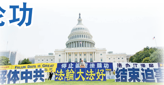
美国东部部分法轮功学员在首都国会山举行大型集会，呼吁制止中共对法轮功的迫害。

已有各级610、政府、公检法人员明白法轮功真相后不愿再参与迫害，在各个环节释放被绑架的法轮功学员和保护法轮功学员。据明慧网2017年1月至6月报道所作的统计，在中国21个省、直辖市的公安局、检察院、法院、中级法院，都有阻止或终止迫害法轮功学员程序的案例，使54名法轮功学员获释，另有97人被退卷的记录。