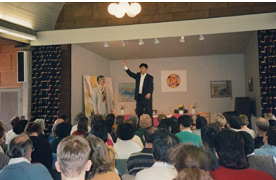
1995年4月，李洪志大师在瑞典哥德堡举办了七天的传功讲法班

1995年3月13日李洪志大师受中国驻法大使馆的邀请，在巴黎使领馆文化处举行讲法报告会及第一场海外法轮功学习班，法轮功正式走向海外。同年4月14日李洪志大师来到瑞典哥德堡举办第二场海外法轮功学习班。法轮功洪传遍及五大洲114个国家和地区。