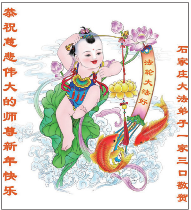
大陆法轮功学员向师父恭祝新年好