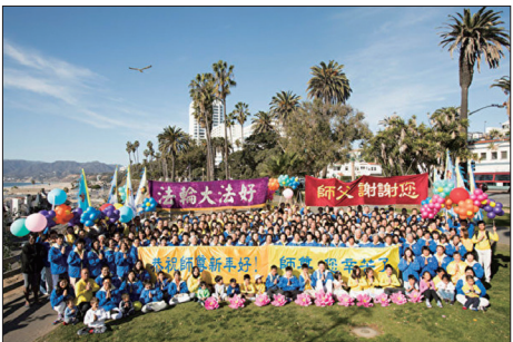
洛杉矶部分法轮大法学员向师父拜年