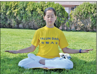
第五套功法-神通加持法