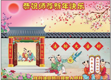
中国各地民众恭祝李大师新年好