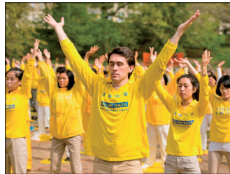
第三套功法-贯通两极法