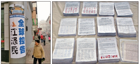
左:中国各地出现大量诉江标语，图为丹东市。右:河北唐山逾四万五千人举报江泽民

各地出现大量诉江标语，越来越多中国民众签名声援诉江和控江。如河北唐山市逾四万五千人举报江泽民；辽宁省鞍山市、朝阳市举报江泽民的民众约十万人；济南地区逾21000名民众签名举报和支持起诉江泽民。海外有31个国家、超过260万人签名参与举报江泽民的全球联署行动。