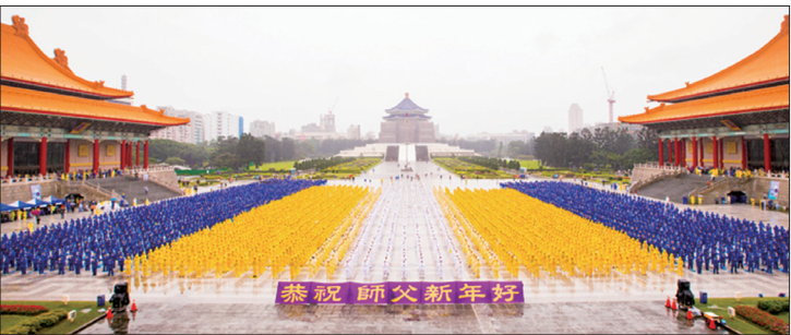
约6400名来自台湾及世界各地部分法轮功学员，11月25日齐聚在中正纪念堂排字，向法轮功创始人李洪志先生拜早年。

一名七十九岁的老人在四年前患了直肠癌，术后化疗折磨导致身体非常虚弱，邻居一位法轮功学员得知后，告诉他诚念“法轮大法好，真善忍好”、退出邪党的一切组织，就能保平安。老人天天默念那九个字，很快就恢复健康。两年多来一切正常，再也没有做过化疗。现在他满面红