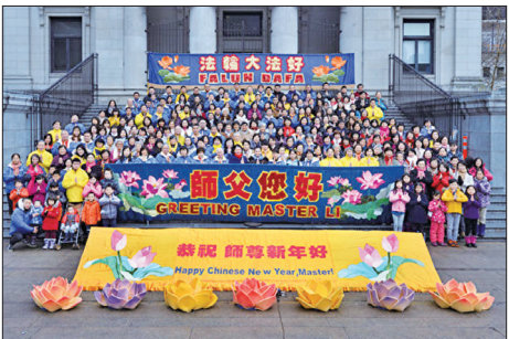
温哥华地区部分法轮功学员在罗宾逊广场上集会合影，向李洪志师父拜年。