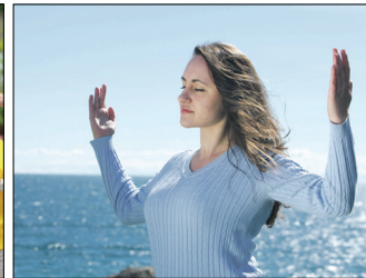
第二套功法-法轮桩法