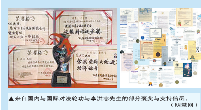
▲来自国内与国际对法轮功与李洪志先生的部分褒奖与支持信函。（明慧网）

法轮大法，又称法轮功，是由李洪志先生创编的佛家上乘修炼大法，以“真、善、忍”为修炼原则，同时包含5套缓慢优美的功法动作。由于是性命双修功法，只要坚持修炼者无不身心受益，自1992年在中国长春公开传出后，至今已弘传全世界1百多个国家和地区，有上亿人修炼，