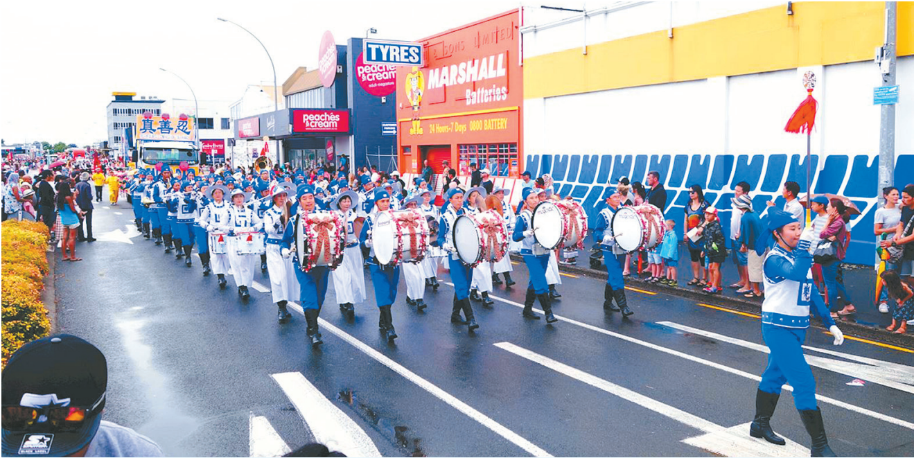
▲天国乐团参加新西兰汉密尔顿的圣诞游行。

2017年12月10日新西兰的法轮功学员们，应邀参加新西兰汉密尔顿市中心举行的圣诞游行，受到人们的欢迎。